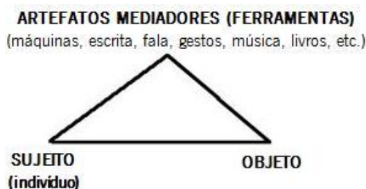
Figura 2: Relação mediada do sujeito com o meio ambiente (Daniels, 2003)

como foco as actividades desenvolvidas pelo ser humano no seio social. Estas actividades são mediatizadas pelo uso das tecnologias que emergem das próprias necessidades dentro de um contexto sócio, político e cultural. Por isso, são consideradas como veículos da experiência social e do conhecimento científico sujeitas a transformações ao longo da história (ver figura 2), a que Vygotsky alude como relação de mediação entre o indivíduo e o ambiente.