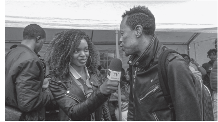
Ilustrações 04 e 05 – Présence des médias.