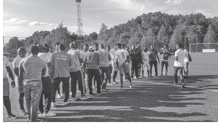
Ilustração 03 – Présentation des équipes à l'image de ce qui se fait dans les grandes compétitions.

Pour magnifier la situation de big man , la mise en scène de ces manifestations en fait les dépositaires des symboles nationaux. L'un des éléments importants est le fait de faire venir des anciens internationaux qui vont jouer avec les couleurs nationales ou des joueurs en activité qui viennent regarder les matchs. La présence d'une autorité de la ville (Maire, bourgmestre...) dans laquelle se déroule le tournoi rehausse le statut de l'organisateur, puisqu'il renforce l'idée de représentation de la figure de «diaspora». Les matchs d'honneur (rencontre entre les anciens internationaux et la finale) confirment cette image. Le rituel d'avant-match reprend en effet tous les éléments d'affirmation de l'autorité sur le modèle des rencontres internationales: les joueurs des deux équipes alignés sont présentés par leur capitaine à des personnalités dont le Président du comité d'organisation est le leader, juste avant l'hymne national. Le Président donnant le coup d'envoi officiel clôturé le cérémonial d'avant-match qui lui confère la stature du big man . Leur portée symbolique permet à ceux qui ont la responsabilité de ces tournois de renégocier des positions de prestige, ou d'expertise notamment auprès des responsables fédéraux. Lors de séjours d'officiels en Europe, ou lors de retours au pays, ils sont sollicités pour leur savoir-faire et ils entretiennent ces positions en se mettant en scène en photos avec ces dirigeants ou des joueurs à fort prestige.