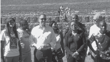
Ilustração 02 – Photo de la présidente d'association, en présence du Bourgmestre et de la représentante de l'ambassade du Cameroun.

Ils viennent me chercher parce qu'ils savent qu'avec mon réseau, leur événement sera diffusé partout. Comme j'ai des accords avec la chaîne nationale pour leur émission du matin, des sites Internet comme camer.be et même ma plate-forme Youtube. L'image là, c'est quelque chose qui est important. Quand ça passe, ils reçoivent des coups de fil de partout, on connaît leur événement. Et puis les familles de ceux qui y participent ou y assistent ont une occasion de les voir. Souvent des gens qui me reconnaissent viennent me dire "tu es trop fort! Les gens m'ont appelé du pays, des États-Unis, pour me dire qu'ils m'ont vu à la télé". C'est important, qu'on les voie à la télévision, et beaucoup me sollicitent pour leur proposer des médias quand ils rentrent au pays.