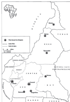
Ilustração 02 - Les villes et lieux de résidence des Sénégalais au Cameroun