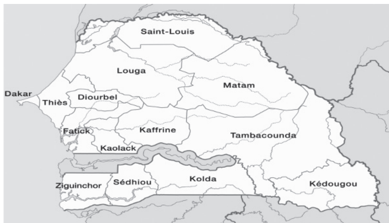
Ilustração 01 - Représentation du Sénégal