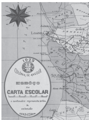
Ilustração 02 - Extrato, Mapa da Colônia de Angola, 1929