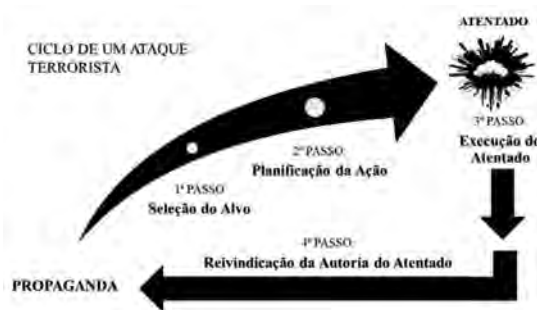
Ilustração 01 - Ciclo do Ataque Terrorista

Gonçalves&Reis (2018) apresentam, de forma sequencial o ciclo de um ataque terrorista, tendo em conta a seleção do alvo, a planificação da operação, a execução do atentado e a reivindicação. Nas últimas etapas de ciclo de um atentado, a propaganda é um elemento que entra em ação, conforme se pode constatar, a ilustração 01. Este ciclo é marcado pela forte presença de violência física, no início, e de violência estrutural e cultural, durante a sua execução e reivindicação.