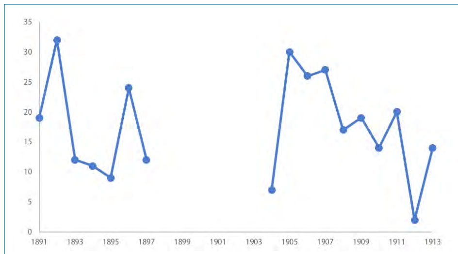
Gráfico 1. Distribuição anual de óbitos do distrito, 1891-1897 e 1904-1913

Fonte: Registos civis de óbito de Guanambi; Livro paroquial de óbito de Monte Alto