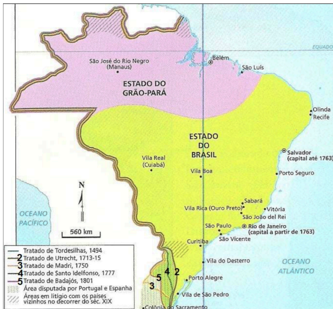
Fig. 2. Mapa do Brasil e Tratados de Fronteira na região sul