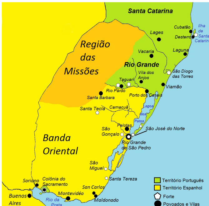
Fig. 3. Mapeamento do extremo sul da América