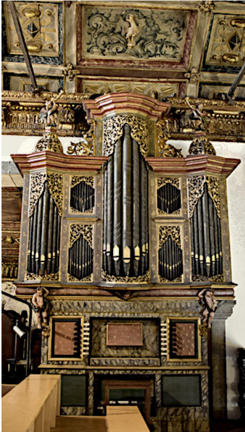
Fig. 1. Órgão de tubos da Igreja do Bom Jesus de Matosinhos Fotografia: Anastasia Sazontieva (junho de 2023)

As palavras do padre e os detalhes relacionados com o posicionamento permitem-nos concluir que o instrumento foi colocado no coro alto do lado do Evangelho, sem tribuna e sem ter sido embutido na parede. Agregando todos os dados, como a possível encomenda da matéria-prima pelo organeiro, o tamanho médio do instrumento e o seu posicionamento; cremos que a máquina e a estrutura básica podem ter sido construídas na oficina do mestre organeiro enquanto a caixa terá sido executada na oficina do mestre entalhador e ensamblada no local de destino.