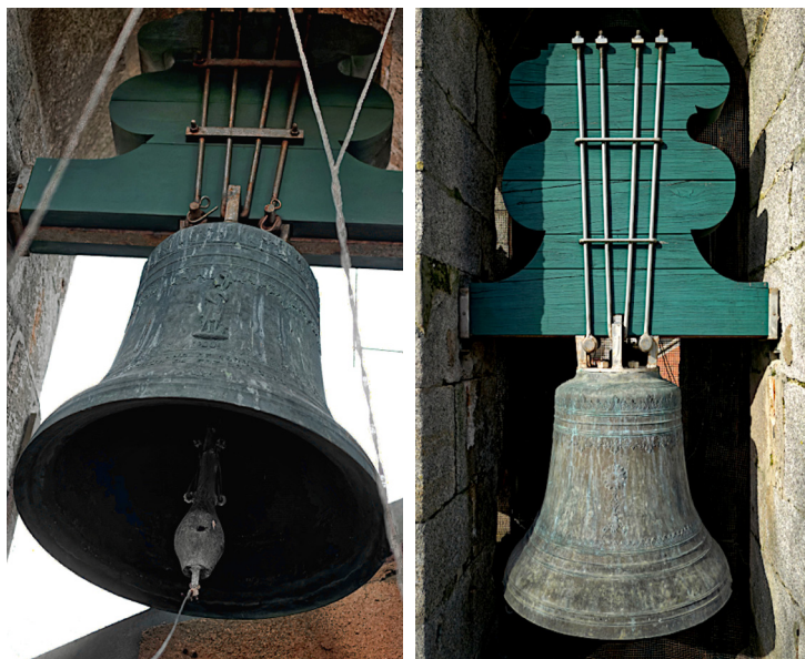
Fig. 6. Sino da torre poente. Vão virado ao largo da igreja. Duas faces, 2023