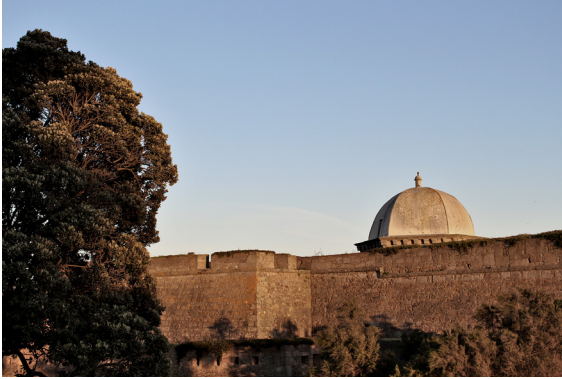
Fig. 1. Fortaleza de São João da Foz do Douro e cúpula da antiga igreja renascentista, 2019