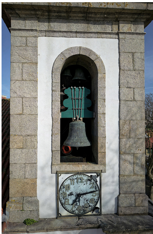
Fig. 5. Sino da torre poente, 2023