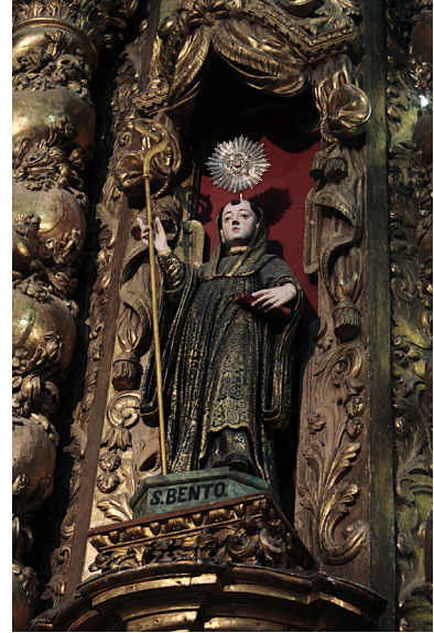
Fig. 2. São Bento. Retábulo-mor da igreja paroquial da Foz do Douro, 2021