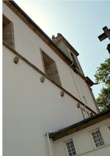
Fig. 4. Fachada ocidental da igreja paroquial da Foz, 2022

«carrilhão, afinado musicalmente», com o peso de «dois mil cento e desasseis quilos» (AMF. Substituição dos sinos... , fl. 2).