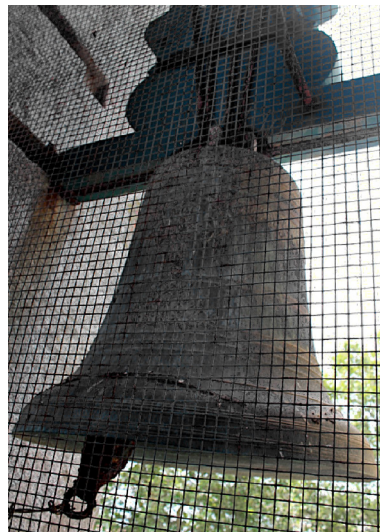
Fig. 8. Sino da torre nascente. Duas Faces