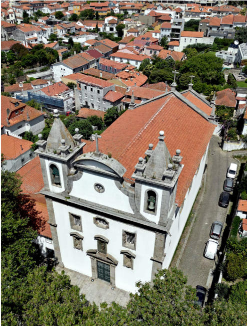
Fig. 3. Igreja paroquial da Foz do Douro, 2022