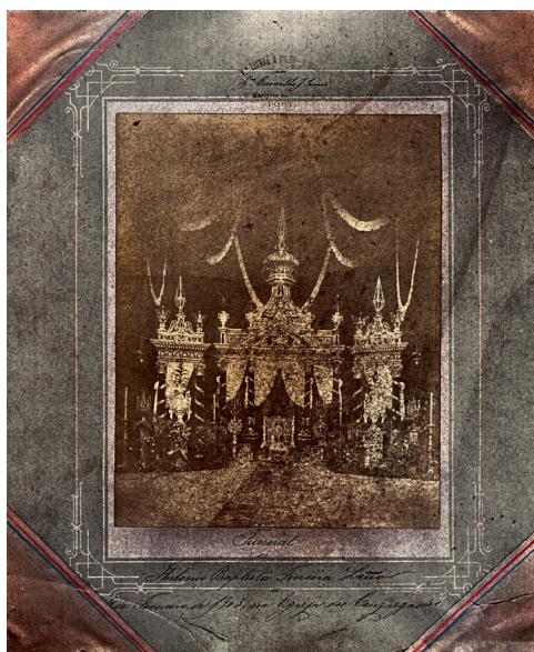
Fig. 3. Armação funerária na Igreja dos Congregados (Porto). Digitalização de positivo fotográfico sobre cartão [s.d.] [c. 1903].

revestido exteriormente por tecidos adamascados e o vão que lhe dá acesso com cortinas que pendem das sanefas, assim como o varandim que o sobrepuja. Vasos com palmitos de flor marcam um ritmo que parece imitar o dos pináculos.