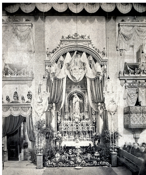
Fig. 2. Altar na Capela das Almas (Porto). Digitalização de positivo fotográfico [s.d.].