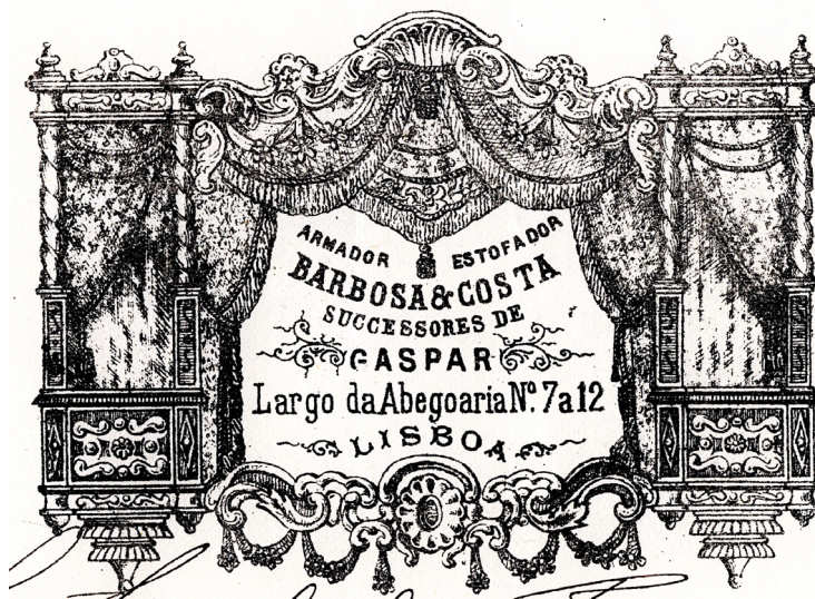
Fig. 1. Recorte de fatura, c. 1883