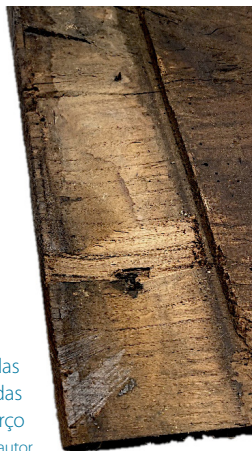
Fig. 5. Detalhe do rebaixo numa das pranchas, destinado ao encaixe das travessas de reforço

Existem três travessas de reforço nos topos do tardo, uma no topo superior e duas segmentadas no inferior. Estas encontram-se inseridas num rebaixo horizontal presente nas pranchas (Fig. 5), possivelmente destinado ao encaixe do painel na estrutura retabular. Destas traves, apenas o segmento inferior esquerdo se supõe ser original, dado que foi realizado com a mesma madeira que o painel, madeira de castanho, e por se encontrar pregado com elementos metálicos de produção manual. Conjetura-se que, este elemento, fizesse já parte da estrutura retabular onde as tábuas do painel estariam pregadas, tendo sido seccionado aquando da sua remoção. Os restantes elementos são fruto de uma intervenção posterior, tendo sido realizados com madeira de eucalipto e pregados com pregos metálicos de produção industrial. No reverso, são ainda visíveis algumas marcas de ferramentas de corte grosseiro e de desbaste. Destaca-se a utilização de serras, com marcas visíveis ao longo das pranchas; de enxós, nomeadamente nas zonas de interceção das tábuas; e de goivas, conforme observável no entorno dos orifícios da antiga mísula.