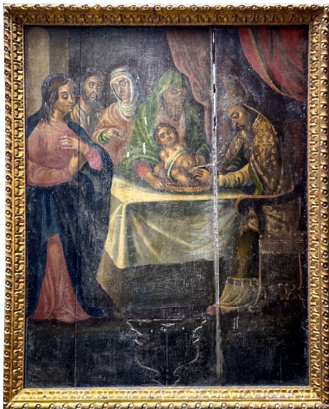
Fig. 1. Painel Circuncisão

tendiam já a desaparecer, uma vez que faziam a manutenção de ideários litúrgicos anteriores ao Concílio de Trento (Lameira e Serrão 2002-2003, p. 64). Do ponto de vista organizacional, possuíam geralmente uma estrutura elaborada e simétrica de geometria plana, normalmente situados à face da parede fundeira do templo. Era frequente a sua estruturação em três tramos e um ou dois corpos, enquadrados por uma gramática decorativa arquitetónica ainda assente nas ordens clássicas. As colunas, tradicionalmente de fuste canelado e terço inferior diferenciado, afirmavam-se como os elementos definidores dos tramos, enquanto o entablamento separava cada um dos corpos e o ático (Lameira e Serrão 2002-2003, p. 76). É no espaço do intercolúnio dos tramos que surgem as pinturas figurativas, como a presentemente analisada. Dado o tema do painel Circuncisão , é natural que este ocupasse um dos tramos laterais do retábulo. Observa-se, na zona inferior do painel, as marcas de uma mísula, entretanto desaparecida, que servia de suporte a uma imagem de vulto. Com efeito, durante o século XVII, a imaginária retabular ganhou importância, convivendo com as pinturas figurativas e com os altos-relevos (Lameira e Serrão 2002-2003, p. 73). Estas imagens destinavam-se ao culto dos santos, cuja devoção era geralmente remetida para os tramos laterais. O tramo central ficaria então reservado para um nicho ou para uma representação da crucifixão.