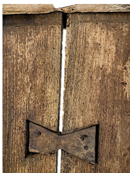
Fig. 7. Descontinuidade na união das pranchas provocada pelo seu empenamento

Regista-se um empenamento em meia-cana na prancha central do painel, que afeta a leitura da pintura. Este empenamento provocou uma descontinuidade na união das pranchas e um desnível na planimetria do painel (Fig. 7). Também as duplas caudas de andorinha e as travessas horizontais deixaram de cumprir a sua função, uma vez que já não são capazes de garantir a estabilidade do painel. Verificou-se a presença de uma infestação xilófaga ativa nas travessas de madeira de eucalipto, orifícios e galerias nas duplas caudas de andorinha e nos painéis de madeira. A base do painel e o interior das tábuas lateralmente acrescentadas (Fig. 8) revelam indícios de podridão cúbica, possivelmente causada pelo fungo serpula lacrymans . Este tipo de podridão provoca a secura e escurecimento da madeira e a sua fratura numa forma cúbica. Os painéis de madeira apresentam ainda sujidade superficial e elementos metálicos oxidados.