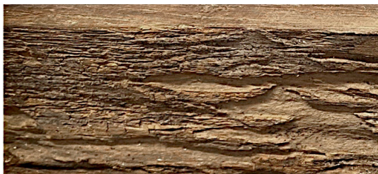
Fig. 8. Detalhe de podridão cúbica numa das tábuas laterais do acrescento da moldura