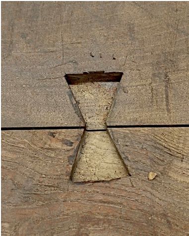
Fig. 4. Encaixe de uma dupla cauda de andorinha com vestígios de adesivo proteico no interior

distribuídas duas a duas ao longo da interceção das pranchas. Foram realizadas em madeira de castanho e apresentam vestígios de adesivo proteico na zona de encaixe (Fig. 4), estando reforçadas com pregos de produção industrial. Tradicionalmente, as duplas caudas de andorinha eram colocadas na zona frontal da obra, antes da execução dos trabalhos de pintura. Ficavam então ocultas pela camada de preparação e pela camada pictórica (Carvalho 2012, p. 84). Quando este sistema de união se encontra no reverso, é frequentemente fruto de uma adição posterior, sendo raramente utilizado como processo original de assemblagem dos painéis (Freire 2024, p. 107) 2 . Atentando à cronologia do painel Circuncisão , a utilização de duplas caudas de andorinha também não seria a mais frequente, uma vez que, em Portugal, se dava preferência ao uso de