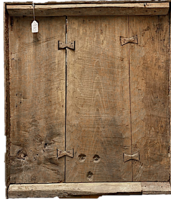
Fig. 3. Tardoz do painel