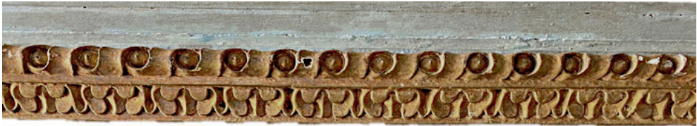
Fig. 6. Moldura do painel com frisos vegetalistas e geométricos

Segundo uma estratigrafia típica, a moldura seria revestida com um aparelho tradicional. Este aparelho corresponde a uma camada de encolagem, geralmente um adesivo proteico à base de cola animal, e a uma camada de preparação, constituída por um adesivo proteico e por uma carga inerte à base de cré ou gesso. Estas camadas são aplicadas sobre o suporte, tendo como função impermeabilizar e uniformizar a superfície destinada ao douramento (Sério 2013, p. 86). Na moldura do painel, a camada de preparação apresenta alguma pulverulência pontual, possivelmente devido à degradação do aglutinante, originando o destacamento das camadas que lhe estão adjacentes. Nos pontos da moldura com maior desgaste, é possível observar o bolo arménio de tonalidade avermelhada. Sobre este foi então aplicada a folha de ouro, segundo o processo de douramento a água.