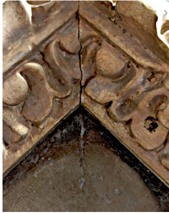
Fig. 10. Detalhe de sulco na camada cromática, no ângulo superior esquerdo da obra