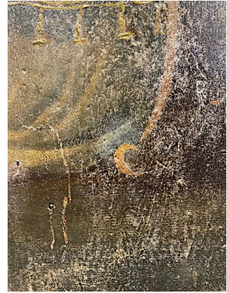
Fig. 11. Áreas de pasmado no verniz