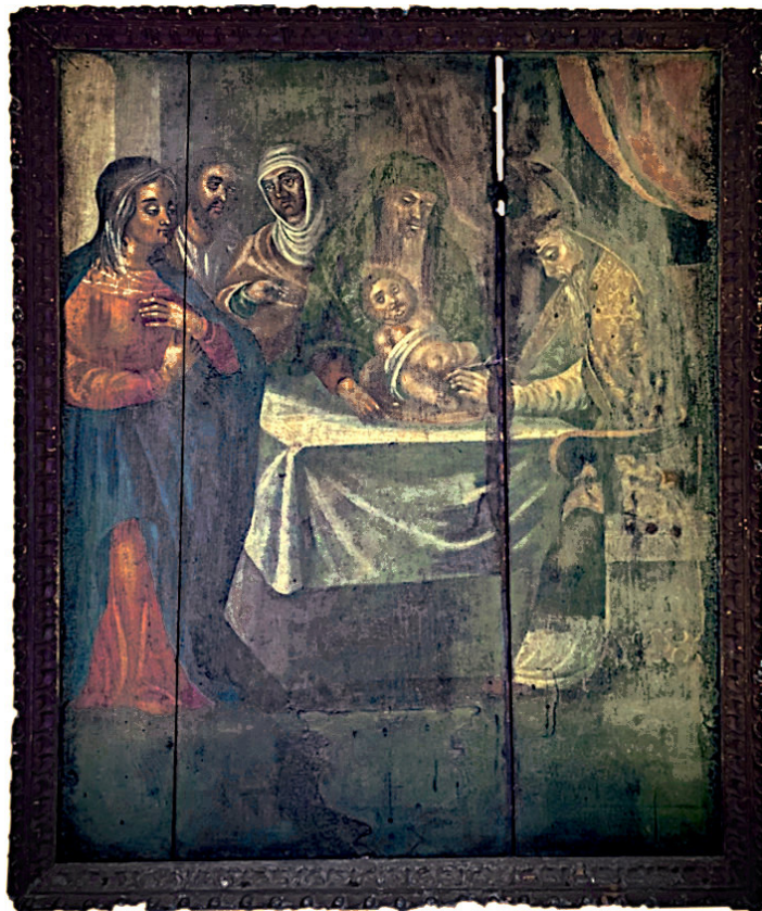
Fig. 12. Painel Circuncisão sob luz ultravioleta, onde se observa a luminescência do verniz