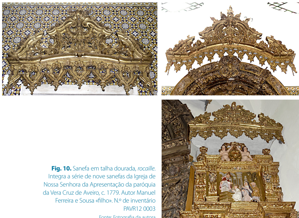
Fig. 10. Sanefa em talha dourada, rocaille . Integra a série de nove sanefas da Igreja de Nossa Senhora da Apresentação da paróquia da Vera Cruz de Aveiro, c. 1779. Autor Manuel Ferreira e Sousa «filho». N.º de inventário PAVR12 0003

O conjunto de nove sanefas em madeira entalhada e dourada da Igreja de Nossa Senhora da Apresentação de Aveiro é constituído pelos seguintes elementos: uma sanefa de grande dimensão adaptada ao arco cruzeiro; um par de sanefas sobre os altares colaterais; um par de sanefas dos altares laterais da nave; e quatro sanefas de menor dimensão colocadas no remate superior das portas da igreja. Correspondem ao modelo já descrito: peças longitudinais com moldura em caveto 8 e perfil em arco abatido ao centro; têm aba ou lambrequim a simular franja com motivos vegetalistas suspensos na forma de folhagem de acanto tripartida; remate em frontão quebrado com grinalda de flores; a secção central é ocupada por uma palmeta, folha de palma entalhada, recortada e dourada; nos extremos fecha com aletas e uma rocalha 9 ao centro sobre voluta em «S» invertido.