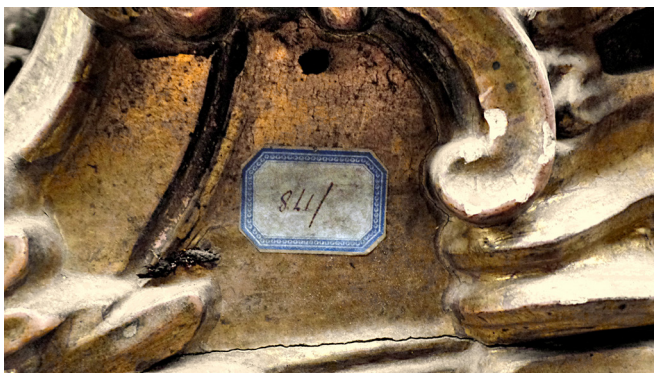
Fig. 5. Sanefa da igreja do Convento das Carmelitas de Aveiro, c. 1779. N.º de inventário antigo, validado nos inventários de 1922 e 1942. Transferência legal para o acervo do Museu de Aveiro, 1911

na obra As Carmelitas em Aveiro: ontem e hoje , em 1996, identificou no cadastro de 1905 a «sanefa de talha dourada n.º 28» fazendo-lhe corresponder um outro item registado no inventário de 1922 com o n.º 19; no inventário de 1942 é também identificada a mesma sanefa, mas com o n.º 89.