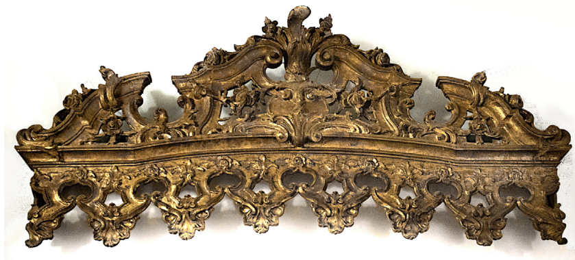
Fig. 1. Sanefa colocada sobre moldura retabular na Igreja de São João de Loure, Albergaria-a-Velha. Rocaille. Sanefa idêntica às presentes nos Conventos das Dominicãs de Jesus e das Carmelitas Descalças de Aveiro, e na Igreja da Apresentação da Vera Cruz, em Aveiro, c. 1775-1779

e até sobre as mudanças e evoluções artísticas e patrimoniais operadas no território envolvente ao antigo convento, no qual se inserem várias casas religiosas da cidade de Aveiro, das quais daremos nota: