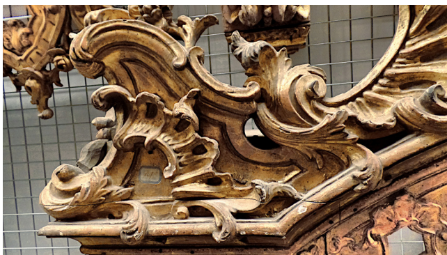
Figs. 3 e 3a. Sanefa da igreja do Convento das Carmelitas de Aveiro, c. 1779. Mecanismo torneado em madeira, interno e em roldana para suspensão dos cortinados