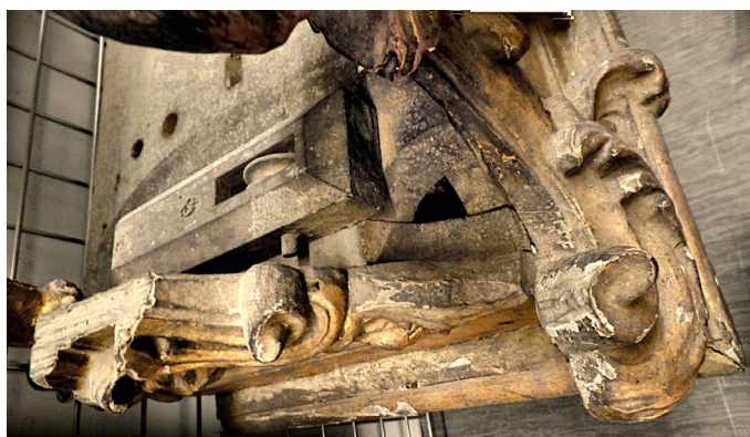
Fig. 4. Sanefa da igreja do Convento das Carmelitas de Aveiro. Detalhes de funcionamento