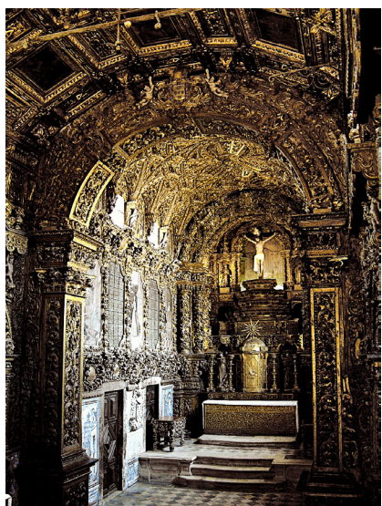
Fig. 9. Igreja de Jesus no início do século XX. As sanefas rocaille rematam os vãos envidraçados e as portas das paredes laterais da capela-mor