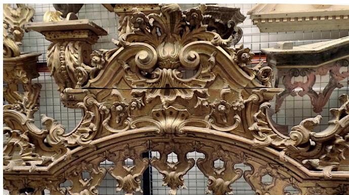
Fig. 2. Sanefa da Igreja do Convento das Carmelitas de Aveiro, c. 1779. N.º de inventário 213/M. Século XVIII. Rocaille . Localização: reservas do MA/SJ, ala norte, 2.º piso

Neste contexto, incluem-se, na estrutura da identidade social e cultural da época vivida entre Quinhentos e Setecentos pela comunidade religiosa dominicana de Jesus de Aveiro, os padroados eclesiásticos e o arrendamento dos dízimos por parte das freiras num território alargado ao qual pertenciam as Igrejas de Valemaior, Fermelã, Canelas, Angeja, São João do Loure e São Paio de Frossos, em Albergaria-a-Velha, inseridas na Zona-Sul do distrito de Aveiro.