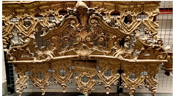
Figs. 7 e 7a. Sanefas da Igreja de Jesus de Aveiro, c. 1775-1779. N.º de inventário 168/M. Século XVIII. Rococó. Localização: reservas do MA/SJ, ala norte, 2.º piso