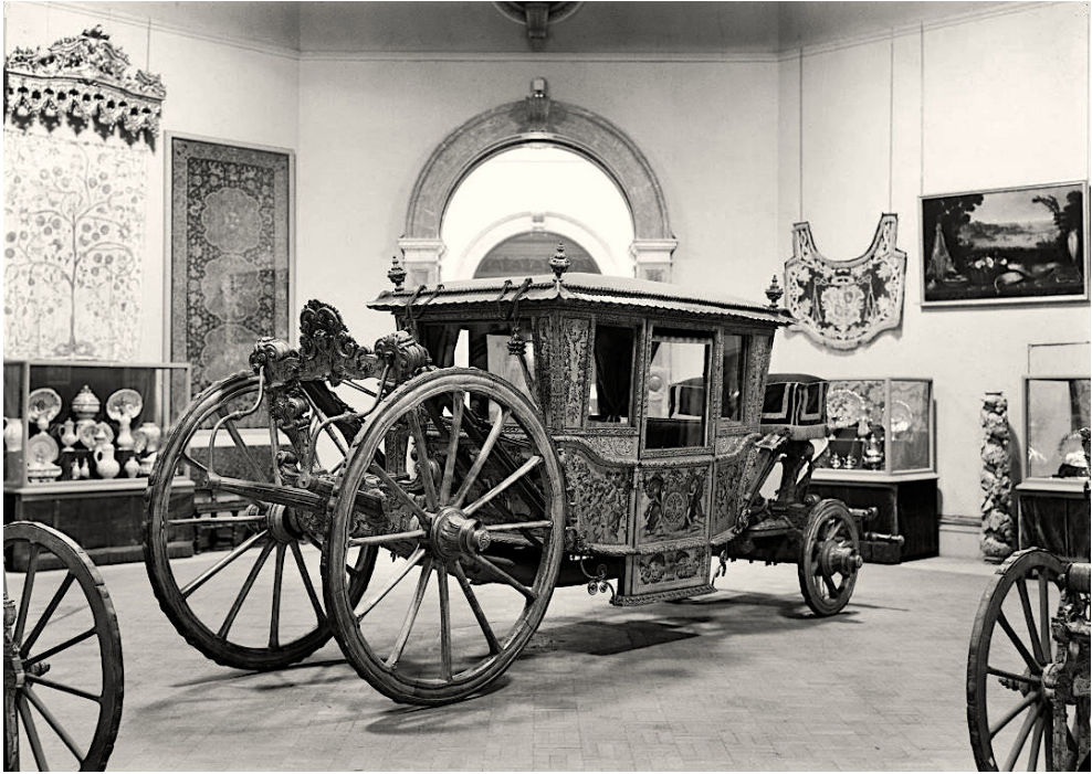
Fig. 6. Exposição de Arte Portuguesa na Royal Academy of Arts de Londres, 1955-1956