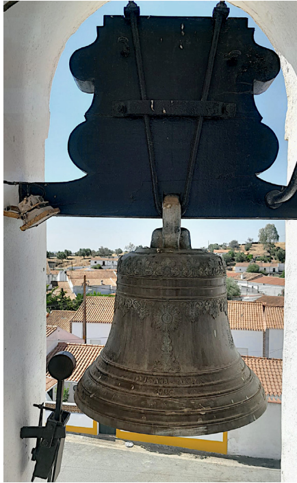
Fig. 6. Sino do relógio, Corte do Pinto, 29 de novembro de 2023