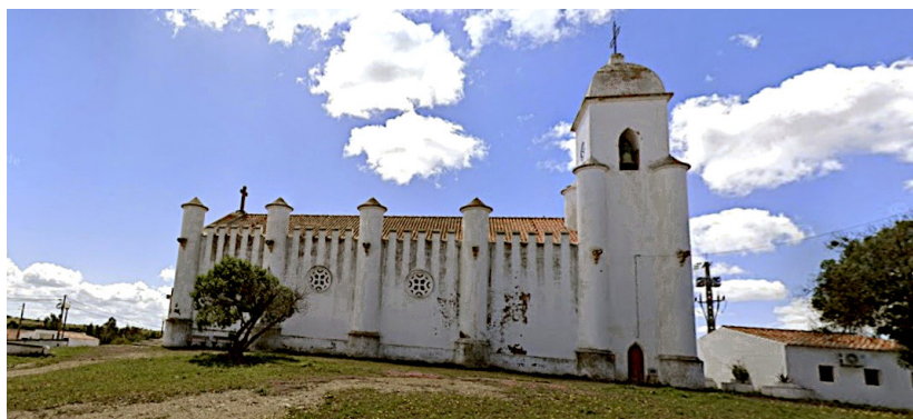
Fig. 7. Igreja da Mina de São Domingos, abril de 2024

A publicação online do Centro de Estudos da Mina de São Domingos (CEMSD) transcreve o «documento número 5 intitulado “Memórias”, referente à Escritura de Empreitada da Igreja da Mina de São Domingos, lavrada no livro de Notas para Escrituras Diversas número 81-C do Cartório Notarial de Beja» e os «documentos apensos à referida escritura», datada de 1950 (CEMSD [s.d.])b). Tivemos acesso a toda a documentação presente na referida escritura no Arquivo Distrital de Beja que inclui procurações, vários desenhos do projeto (Fig. 8) e o Caderno de Encargos (ADB. Documentos apensos à Escritura... , [1950]).