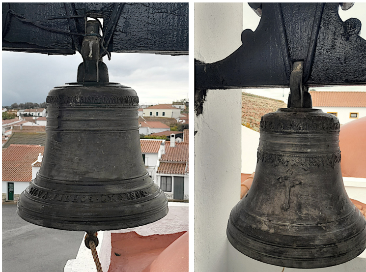
Fig. 5. Imagem à esquerda: sino a sul, Corte do Pinto, 29 de novembro de 2023; imagem à direita: sino a poente, Corte do Pinto, 29 de novembro de 2023

O sino a poente (Fig. 5, à direita) apresenta igualmente uma asa singela e dispõe de uma cegonha que terá permitido, em tempos, o seu bamboar. É o sino com mais elementos decorativos deste conjunto, tendo vários cordões, duas bandas de rendilhas de cariz vegetalista e um crucifixo 22 . Este sino, tal como o sino a nascente, carece de intervenção urgente, uma vez que, segundo Ana Mendes, o badalo já tombou duas vezes.