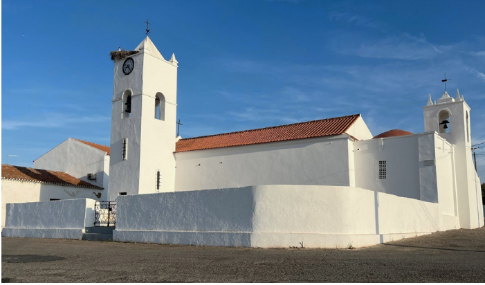
Fig. 2. Igreja de Nossa Senhora da Conceição, Corte do Pinto, setembro de 2024