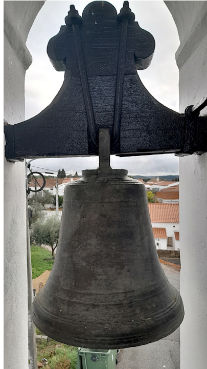
Fig. 4. Sino a nascente, Corte do Pinto, 29 de novembro de 2023