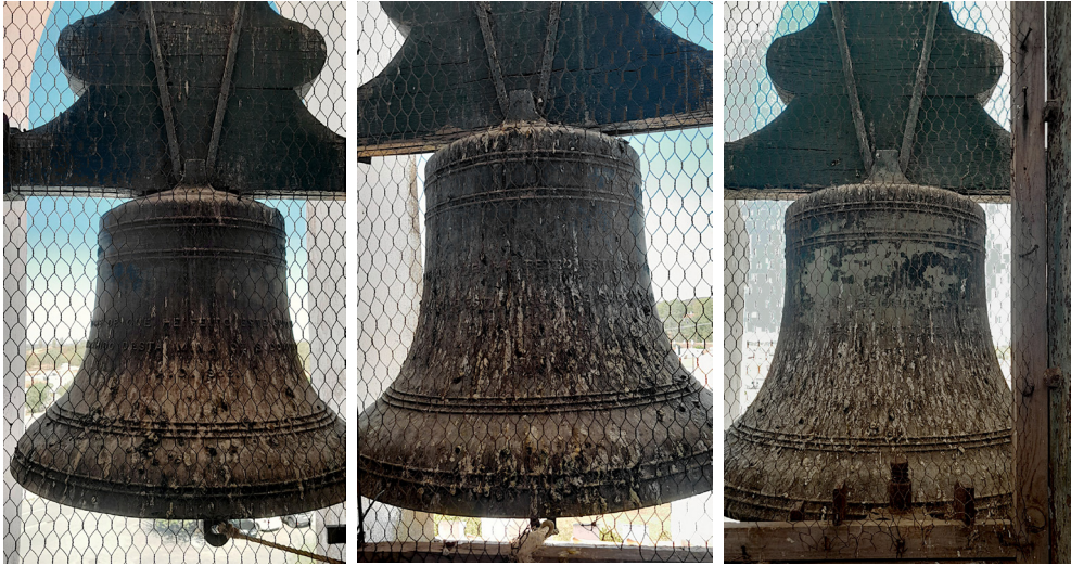
Fig. 9. Da esquerda para a direita: o sino do alçado esquerdo, a sudoeste, agosto de 2024; o sino do alçado posterior, a noroeste, agosto de 2024; o sino do alçado direito, a nordeste, agosto de 2024