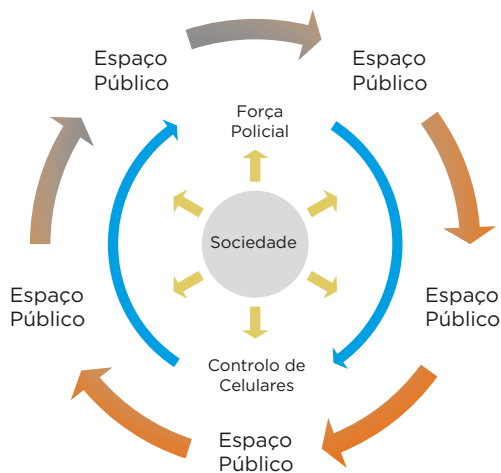
Figura 3. Ressocialização do Controle Social Depois das Manifestações de 2008 - 2010

no controle das manifestações, como esquematizado na figura 3.