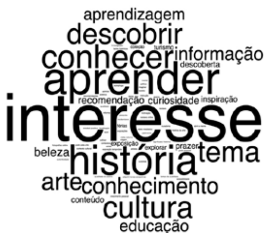
Figura 5. “Nuvem de palavras” referente às motivações para visitar um museu segundo os visitantes do Museu Nacional do Azulejo. Via Wordcloud

Do ponto de vista das motivações negativas, os visitantes inquiridos apontaram razões transversais aos vários museus como o preço do bilhete ou longas filas e tempos de espera, assim como razões associadas à experiência específica de visita a determinado museu como a acessibilidade por exemplo, e também razões consideradas pessoais como a falta de tempo ou de interesse.