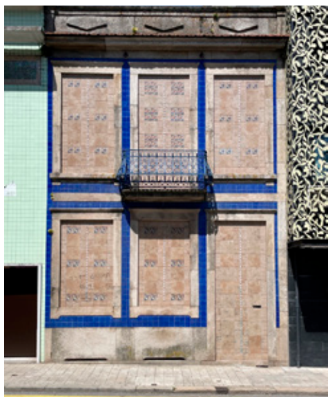
Figura 1. Ejemplo de belleza del abandono. Casa tapiada. Rua de Latino Coelho y Rua da Alegria.