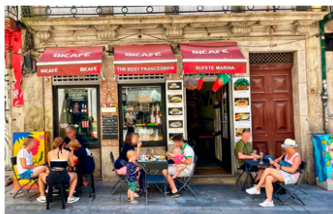
Figura 5. "The best francesinha". Rua das Flores y Rua de Afonso Martins Alho, Sé.

Precisamente, el descuidado y ambicioso trabajo del sector público en su intento por posicionar a Oporto como un destino turístico de interés global ha dado lugar a la emergencia de dos procesos estrechamente relacionados: la turistificación y la gentrificación. Creemos que parte del encanto de la ciudad reside en su imagen parcial de una urbe con una arquitectura delicada y frágil. Es especialmente notable en aquellos barrios y áreas que forman parte del recorrido natural de los visitantes, donde la belleza del abandono aporta valor a los espacios públicos. Por ejemplo, podemos mencionar el Centro de Oporto, que incluye lugares como Cordoaria, Bolhão y los alrededores de la Avenida de los Aliados, así como Cedofeita, La Ribeira y el barrio de la Sé. Además, también encontramos zonas residenciales de clase media/alta como Foz y Boavista, que albergan una amplia variedad de comercios y lugares gastronómicos.