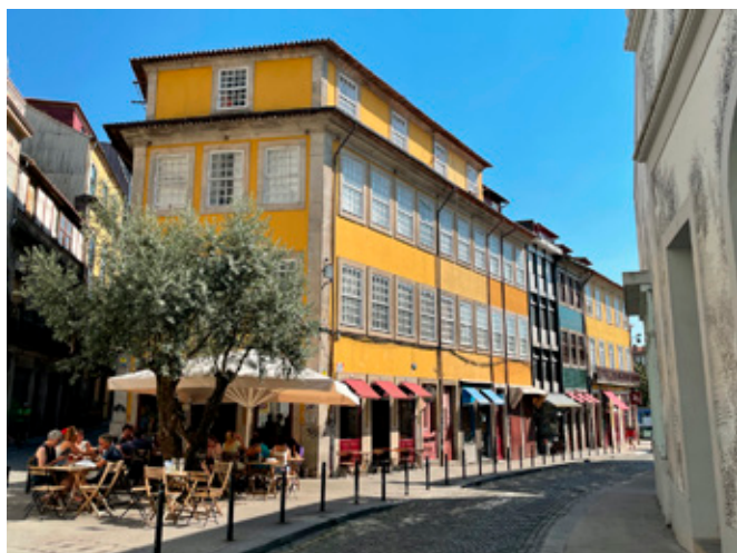
Figura 6. Arquitectura y diseño urbano gentrificado. Rua das Oliveiras y Rua de Sá de Noronha, Vitória.