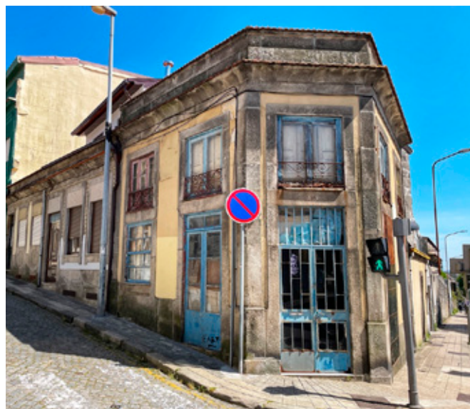
Figura 2. Ejemplo de belleza del abandono. Rua das Eirinhas y Rua de Barros Lima, Bonfim.

que forma parte de un sentido cool y funcional de la estructura urbana. Se aprovecha de la decadencia estética como una herramienta para realzar el espacio público, otorgar valor al entorno urbano y crear un paisaje urbano extraordinario y evocador. Esta estética se convierte en una atracción turística única, donde los visitantes pueden sumergirse en una experiencia urbana interesante, cargada de historia y nostalgia. La belleza de lo roto y lo desgastado despierta fascinación, generando un diálogo entre el pasado y el presente (figura 1).