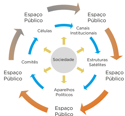
Figura 2. Ressociação do Controle Social Depois das Manifestações de 1993

Depois destas revoltas populares, a Frelimo reformou o modelo do controle social, passando a enquadrar a “sociedade” nos seus organismos como uma ferramenta para adquirir recursos de sobrevivência. Nesta época, o ciclo de ressociação foi caracterizado por mecanismos menos repressivos e de ganhos mútuos, como ilustra a figura 2.