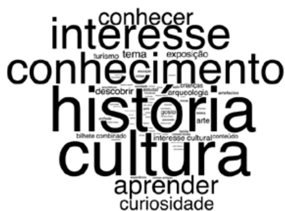
Figura 4. “Nuvem de palavras” referente às motivações para visitar um museu segundo os visitantes do Museu Nacional de Arqueologia. Via Wordcloud

Dentro das motivações positivas encontramos, se quisermos, tendências ou linhas de interesse. Isto é, na maioria dos casos encontramos associadas à motivação para visitar um museu, questões ligadas à aquisição de conhecimento, nomeadamente, versadas nos conceitos de “conhecimento”, “interesse”, “aprendizagem”, “história”, “cultura”, etc. (ver figuras 4 e 5). Contudo, são facilmente identificáveis outras linhas de motivação e interesse, essencialmente ligadas às coleções do museu, à prática de turismo ou contexto de viagem, à atividade profissional do visitante, ao contexto social de visita (ex. tempo em família), mas também à experiência de momentos de lazer e de bem-estar.