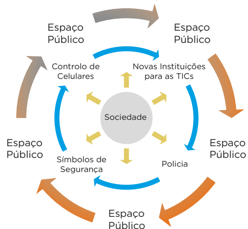
Figura 4. Ciclo de Ressocialização de Controle Social que evita as Manifestações Violentas

por outro, houve um efeito de desmobilizador depois do primeiro mobilizador das marchas contra as dívidas ocultas, ter sido agrdido por desconhecidos. Neste contexto, sugere-se que o ciclo de ressocialização do controle social expandiu os seus mecanismos e passou a adotar a forma representada na figura 4.