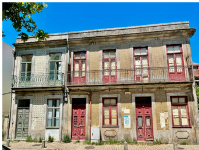
Figura 7. Ciudad escenificada y belleza del abandono . Alameda de Basílio Teles y Rua da Fonte de Massarelos, Massarelos.

2019; Sequera Fernández, 2020). Este fenómeno surge como resultado de cambios en los patrones de consumo y del aumento de los costos de alquiler en los barrios sujetos a gentrificación. Los antiguos establecimientos comerciales, tales como cafeterías, bares, almacenes y tiendas de ropa, se ven obligados a transformarse y rediseñarse con el fin de atraer a la nueva población, lo que refuerza la imagen nostálgica del pasado.