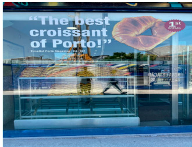
Figura 4. "The best croissant of Porto!". Avenida da França y Avenida da Boavista, Massarelos.

Lopes, 2020). El aumento en el número de turistas y la proliferación de alojamientos turísticos han desplazado a los residentes originales y a los comercios tradicionales en los últimos cinco años; aproximadamente el 40% de las tiendas minoristas en el centro han experimentado cambios funcionales y/o de propiedad (Fernandes et al., 2018) (figura 3).