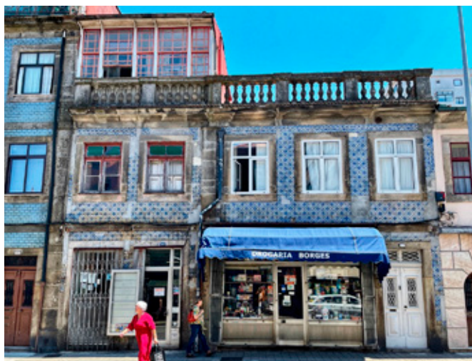
Figura 3. Ejemplo de belleza del abandono y comercio local. Rua de Antero de Quental y Rua da Constituição, Cedofeita.