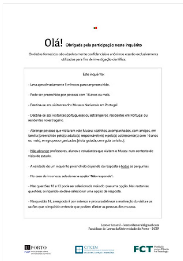
Figura 3. Modelo de Complemento de Inquérito – Versão Portuguesa

encontrar as instruções para o correto preenchimento (Figura 3).