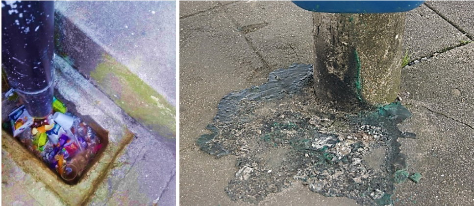
Figura 4. Sarjeta entupida com lixo e caixote de lixo derretido na zona do recreio da Escola.