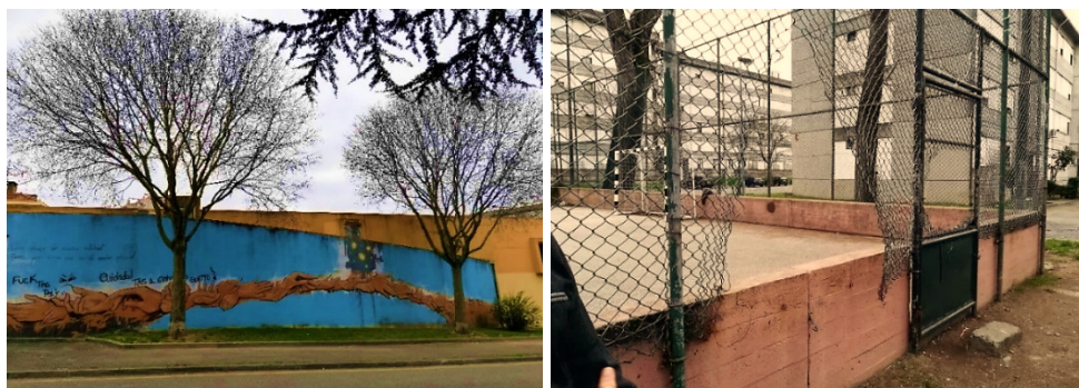
Figura 1. Mural na entrada de um dos Bairros e campo de jogos com as redes deterioradas situado no mesmo bairro.