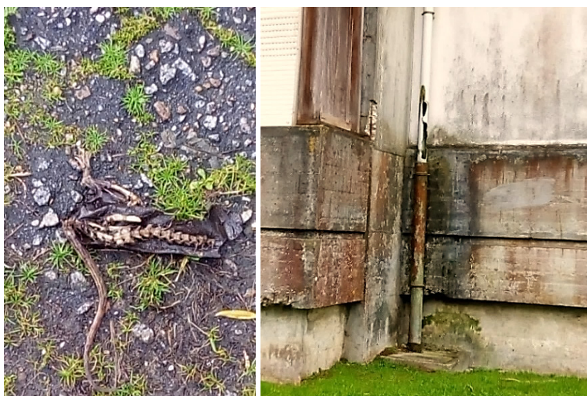
Figura 3. Uma ratazana morta no passeio público e o edificado envelhecido de um dos Bairros (Fotografias de Bru, 14 anos, e Hyro, 17 anos).