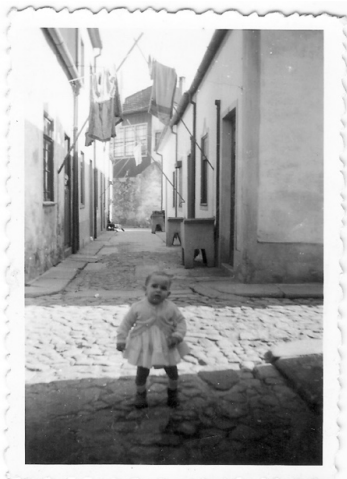
Figura 1. A 5. a rua do Bairro Herculano. Anos 60 do século XX.

As vídeo-narrativas desenvolvidas em colaboração com os habitantes do Bairro Herculano enquadraram-se num trabalho de pesquisa audiovisual participativo e antropológico. As pessoas habitantes do Bairro Herculano desempenharam um papel ativo e consentido em todas as fases do estudo, contribuindo com os seus materiais e perspetivas. A colaboração da comunidade envolveu a cedência de fotografias dos álbuns familiares dos participantes, um dos exemplos dessas imagens é a figura número um, que permitiu o aprofundamento do contexto social e histórico do Bairro.