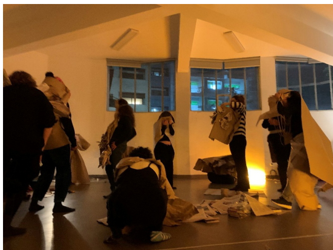
Figura 4. Exploração inicial dos Bichos-Criaturas