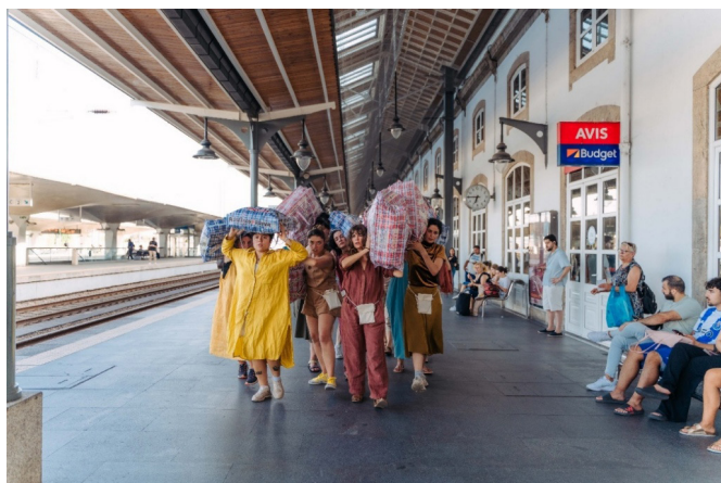
Figura 5. As “cargas” das habitantes do LLP Percurso sonoro “A Cidade Invisível – Cartografia(s) dos Caminhos Diários” (29 de junho de 2025).

imagens performativas, em coletivo, de resignificação de iconografias e de mensagens sexistas; iii) a renomeação de ruas; iv) o reconhecimento das “cargas” individuais, e v) práticas de descanso individual e coletivo, bem como de escuta ativa na caminhada, com potencial para inscrever uma cartografia afetiva no espaço público.