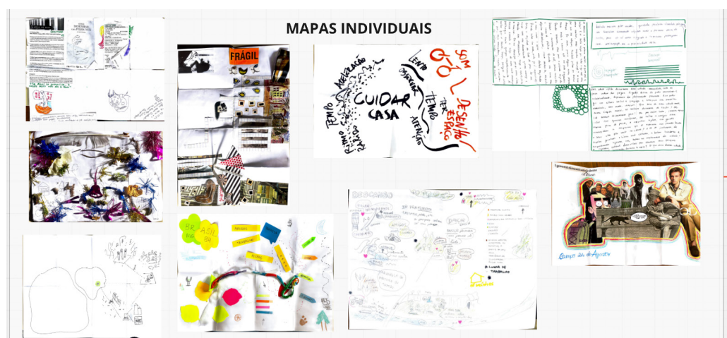
Figura 2. Mapas individuais.

afiar as garras e rasgar as amarras do corpo social soltar o meu animal, numa batida de libertação pessoal. ontem e hoje corpos como mapas cartografias vivas e sentidas, de violências caminhos e trajetos, de resistências identidades que gritam e agitam os espaços que habitamos e nos habitam 14