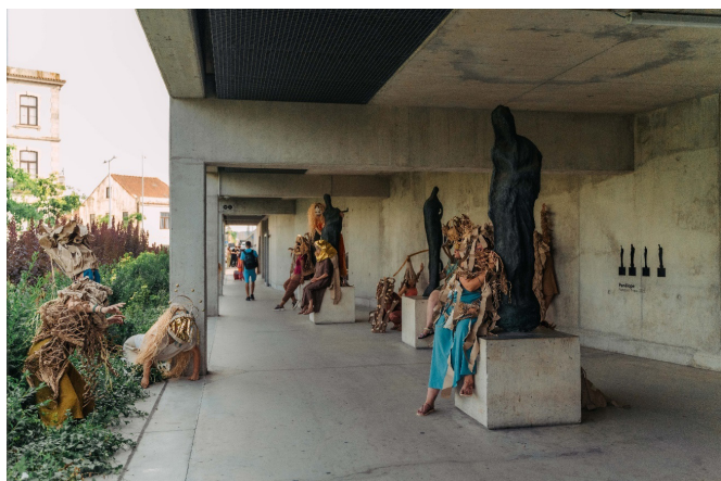
Figura 6. Os Bichos-Criaturas

Percurso sonoro “A Cidade Invisível – Cartografia(s) dos Caminhos Diários” (29 de junho de 2025).