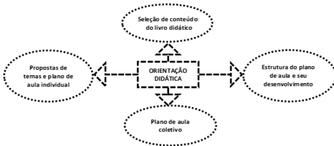
Figura 2: Fluxograma das orientações didático-pedagógicas. Fonte: Trabalho de campo, 2017 a 2019. Organização: Conceição, F. S. da., 2020.

A seleção e escolha de um conteúdo geográfico ficaram a critério de cada grupo, uma vez que a organização dos conceitos básicos no ensino de geografia permite desenvolver um pensamento autônomo a partir da edificação do raciocínio geográfico (Cavalcanti, 2005). O tema escolhido, tomando como base o modelo de plano de aula disponibilizado, foi construído um plano de aula. E, ao final de cada aula ou na próxima aula da disciplina, foram feitas as apresentações e discussões dos temas geográficos de cada grupo. Nessa atividade proposta, os estudantes demonstraram a importância do trabalho em grupo, a criatividade no desenvolvimento de novas linguagens, a assimilação de conteúdos geográficos para a concretização da prática.