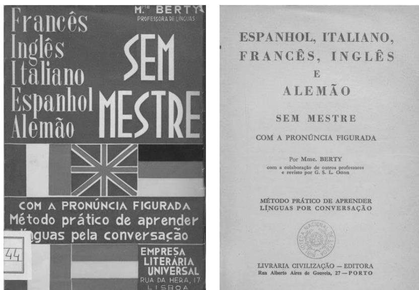
Imágenes 3, 4 – Cubierta y anteportada del Espanhol, italiano, francês, inglês e alemão sem mestre (Lisboa, Empresa Literária Universal; Porto, Livraria Civilização – Editora, 1963)

O espanhol sem mestre dispone tipográficamente la materia a tres columnas – como, por lo demás, otros manuales de la época para la enseñanza de lenguas–, presentando los exponentes lingüísticos en portugués, en español y con su pronunciación figurada. Por lo que se refiere a la macroestructura de la obra, se pueden distinguir dos bloques: 1) el primero integra un breve grupo de unidades centradas en aspectos de tipo –se podría decir– fonético, en las que, tras la presentación del alfabeto (Saiz de Omeñaca 1964: 3), se pasa a una breve descripción sobre la pronunciación de las vocales (Saiz de Omeñaca 1964: 4) y las consonantes (Saiz de Omeñaca 1964: 5-6), en la cual el recurso al contraste con los sonidos del portugués es constante, y, de forma puntual, con otras lenguas, como la referencia al inglés al presentar el sonido interdental fricativo sordo oral: