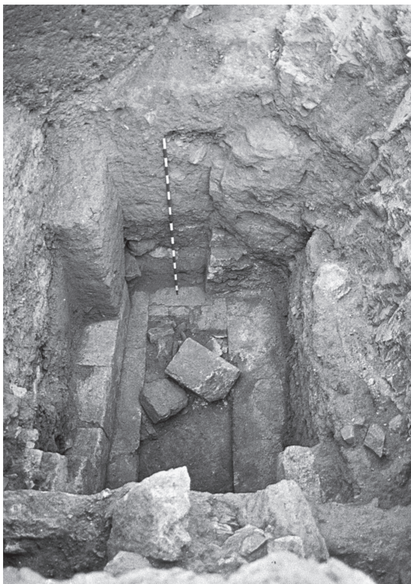
Fig. 4: Hipogeo 4C de Puente de Noy (Fuente: Molina, Huertas).