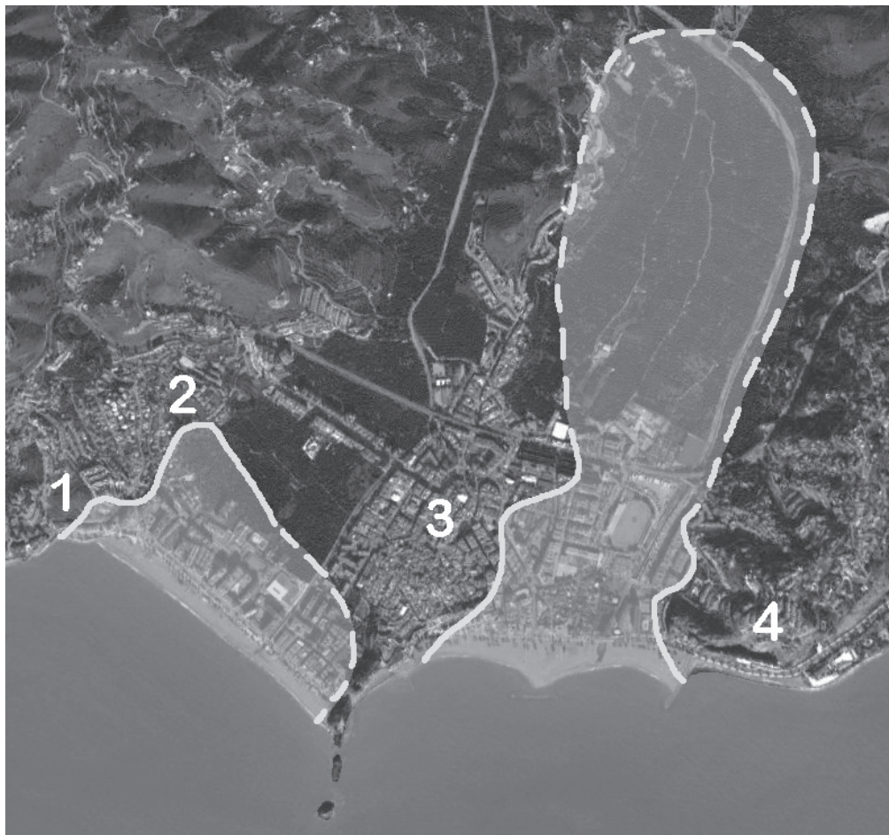
Fig. 2: Ubicación de las necrópolis de Almuñecar y la antigua línea de costa: 1-Cerro de San Cristóbal, 2-Puente de Noy, 3-Iglesia de la Encarnación, 4-Cerro de Velilla