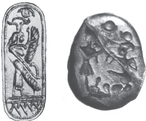
Fig. 3: 1. Sortija de Villaricos. 2. Escarabeo de Ibiza