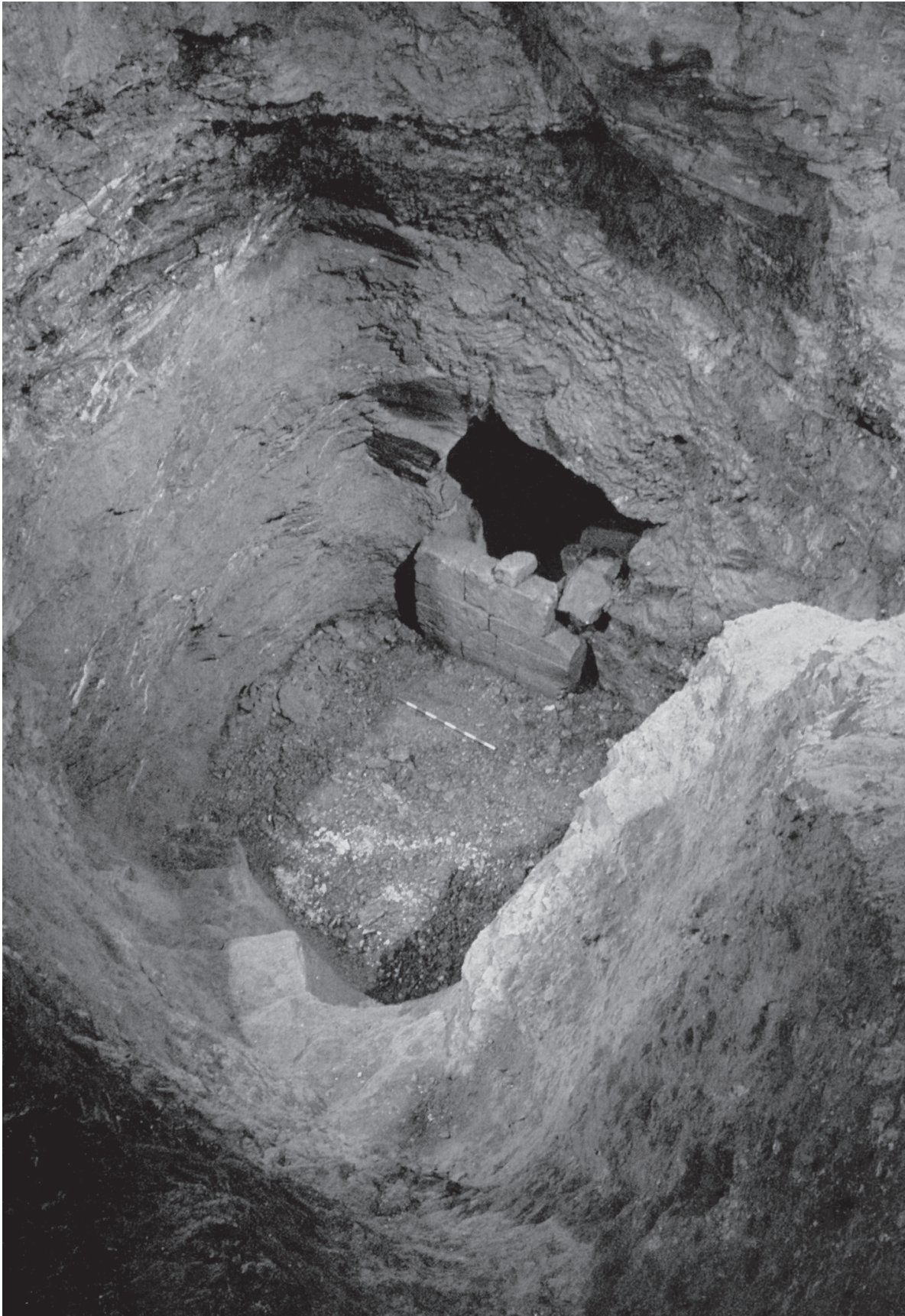
Fig. 5: Hipogeo 1E de Puente de Noy