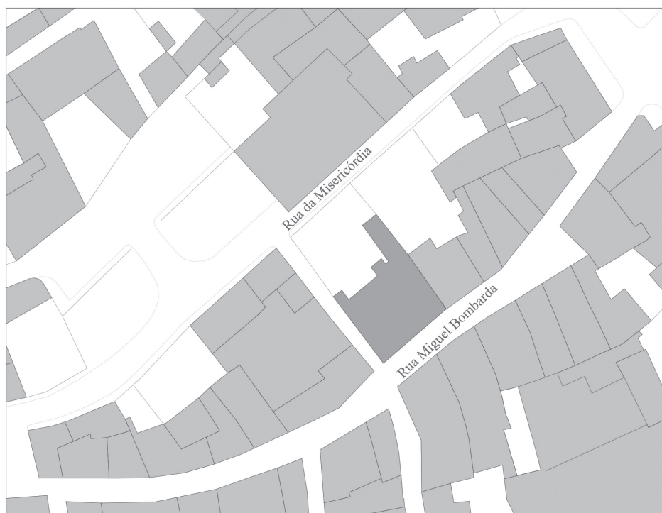
Fig. 2: Planta com a localização do imóvel alvo de intervenção