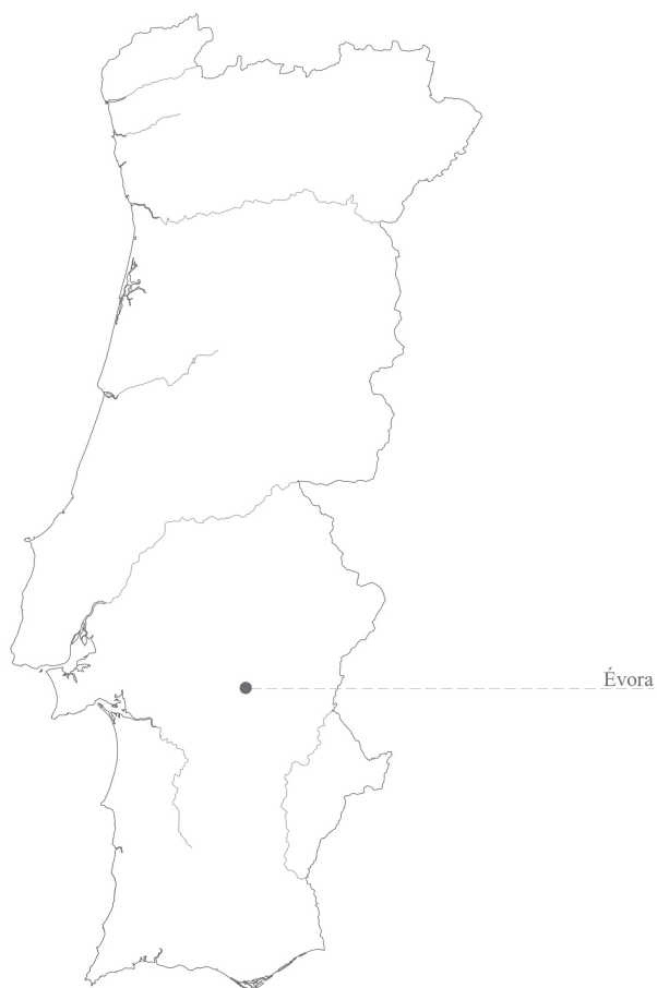
Fig. 1: Planta com a localização da cidade de Évora