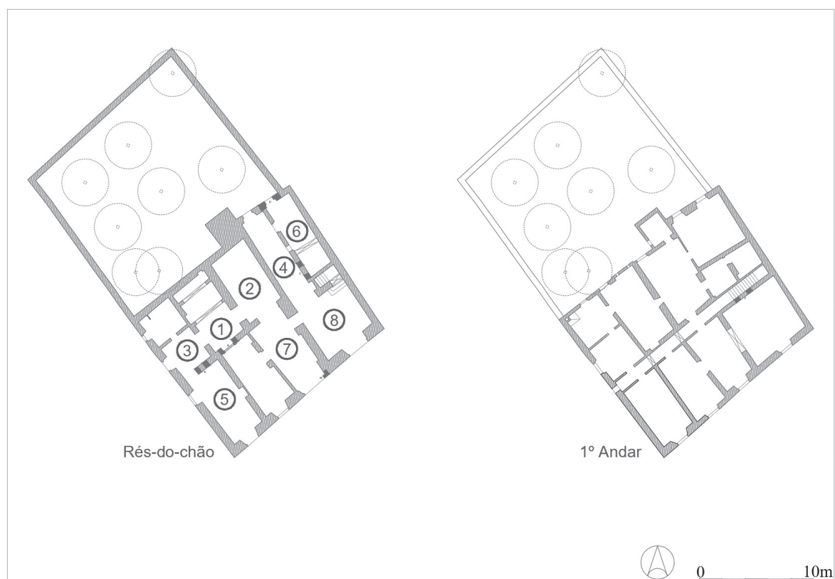
Fig. 3: Localização da intervenção arqueológica, nomeação dos compartimentos Fig. 4 – Pátio – local onde foi encontrado o friso visigótico.