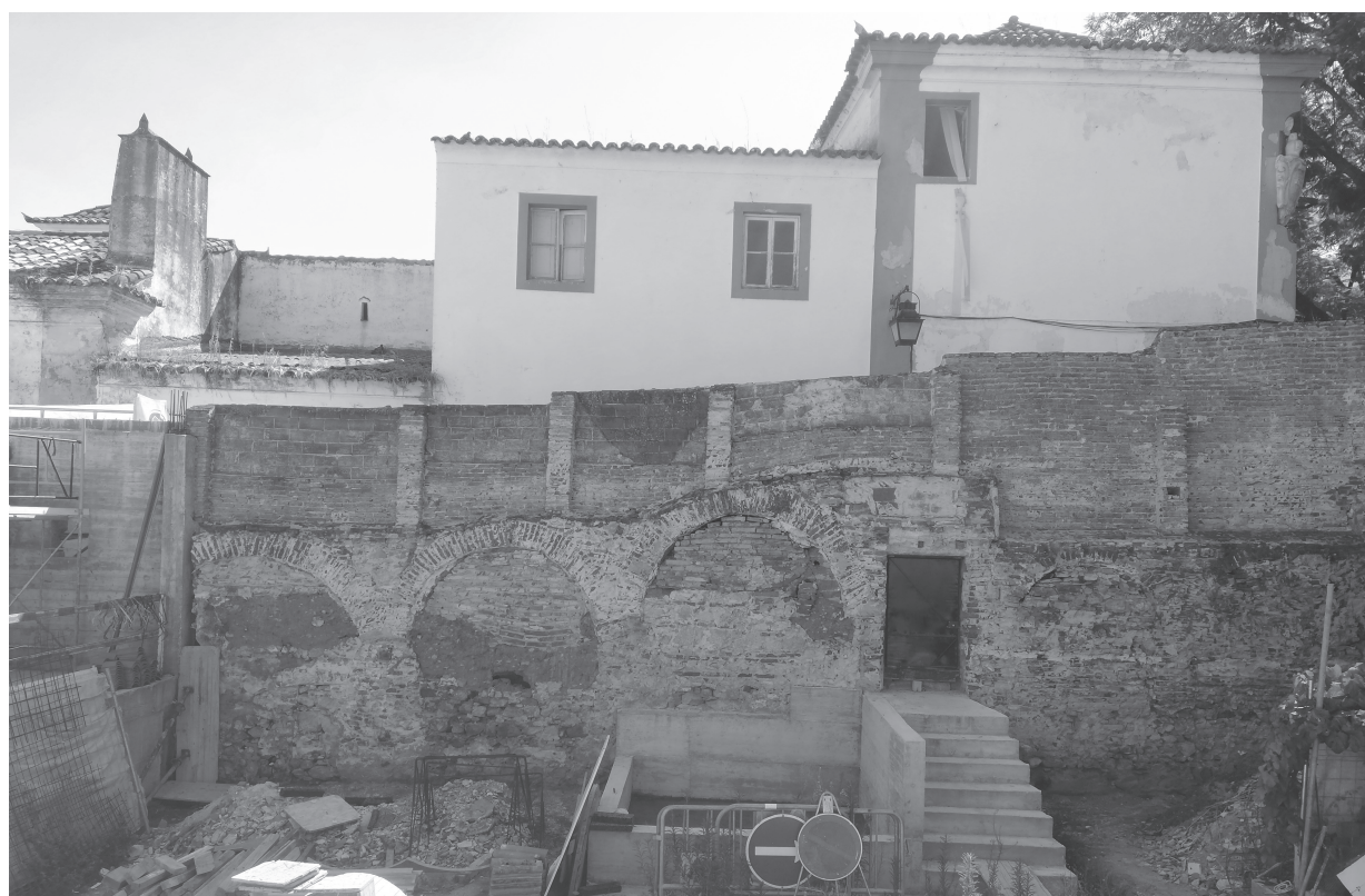
Fig. 4: Pátio – local onde foi encontrado o friso visigótico