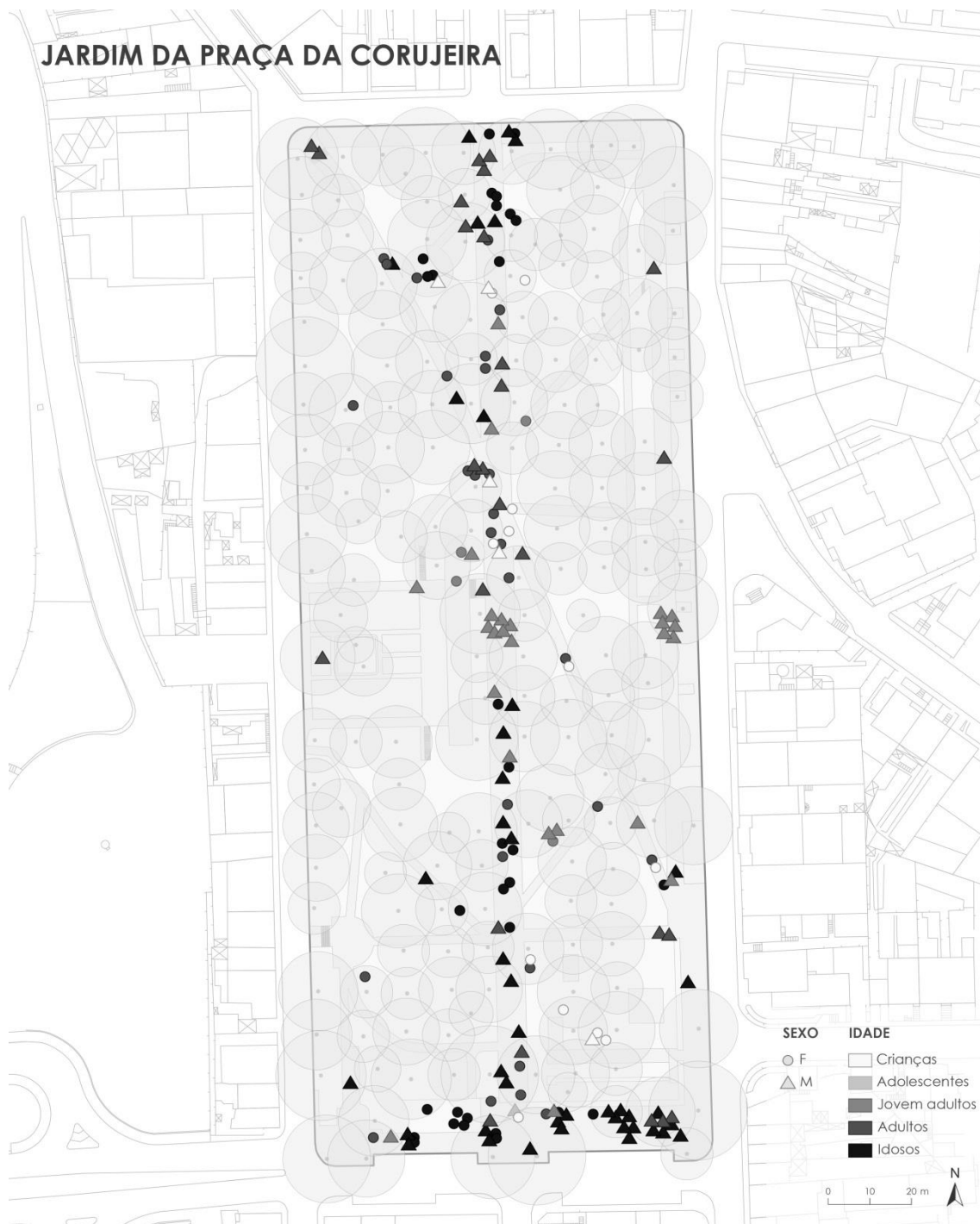
Figura 2. Mapeamento dos utilizadores do Jardim da Praça da Corujeira (n=175) de acordo com o seu género e faixa etária