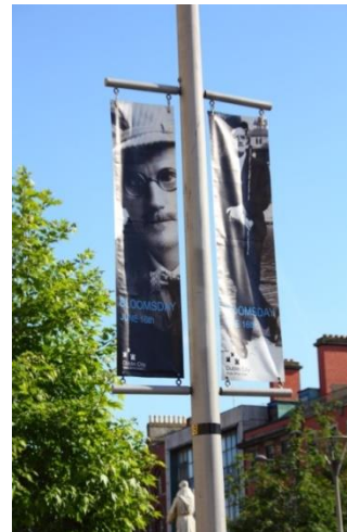
O'Connell Street, 2010

Besides the many events that take place every year, at the James Joyce Centre, during the entire week around June 16, evidence of Bloomsday celebrations can be found everywhere in Dublin.