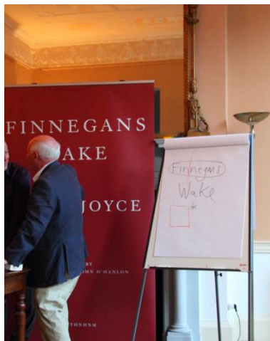
James Joyce Centre, 2010