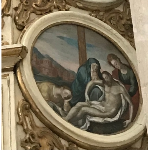
Figura 7 Tondi (detalhe)

Um dos tondi retrata precisamente Maria Madalena aos pés de Jesus e Nossa Senhora: