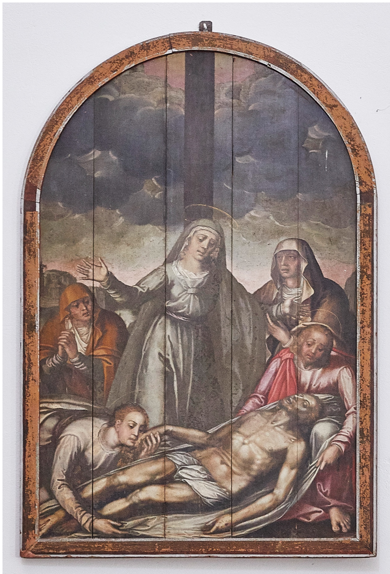
Figura 3 Pintura III