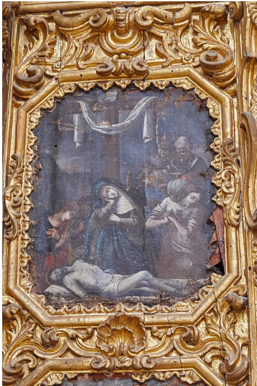
Figura 2 Pintura II