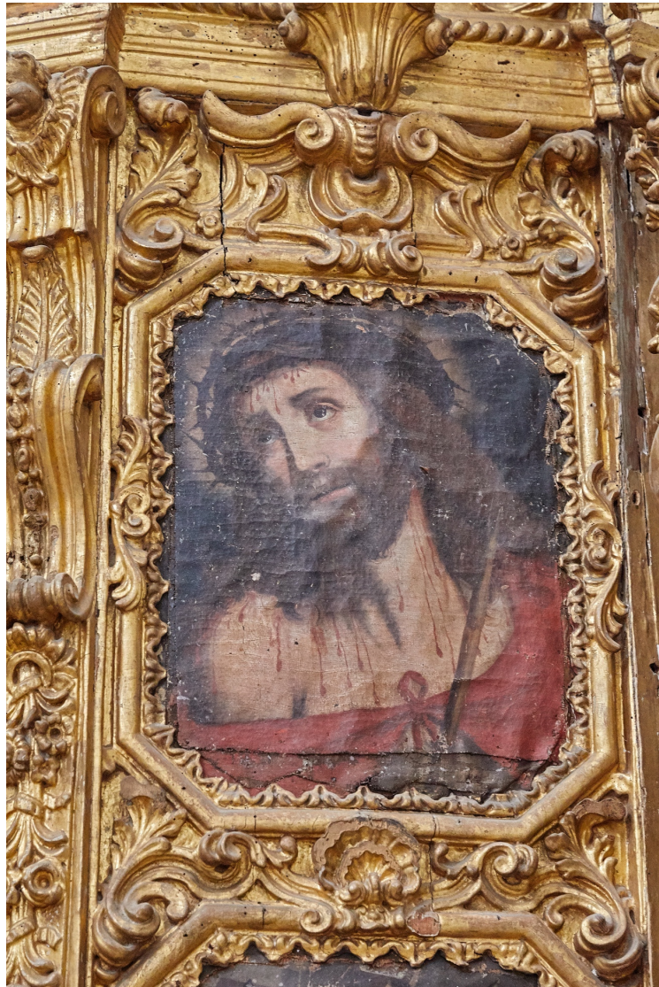
Figura 4 Pintura IV