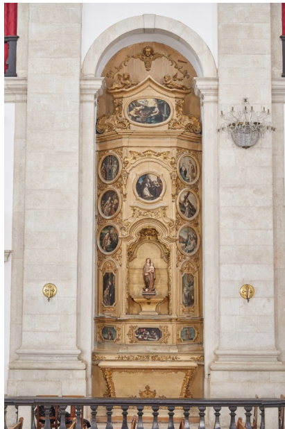
Figura 6 Tondi

Vítor Serrão, a propósito dos seis tondi ainda existentes no mosteiro, que seriam de um antigo altar de Nossa Senhora do Rosário, identificou o seu autor: Simão Rodrigues (1565-1629) (com colaboração de Domingos Vieira Serrão), datando-os do início do século XVII 42 .