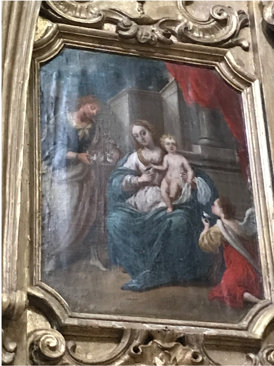
Figura 5 Pintura V