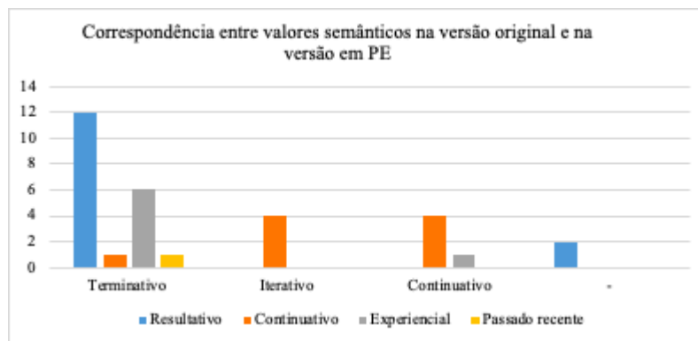
Gráfico 2. Comparação da frequência absoluta das ocorrências dos valores semânticos dos tempos verbais em Inglês e em PE.

De modo a perceber a relação e correspondência entre os valores semânticos da versão original e da tradução, elaborámos o gráfico 2, que analisamos adiante.