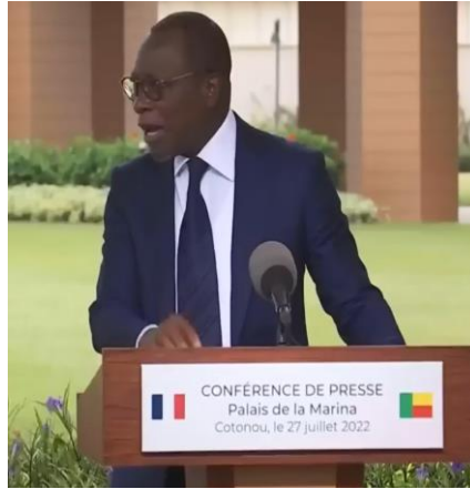
Imagem 2. Talon 3