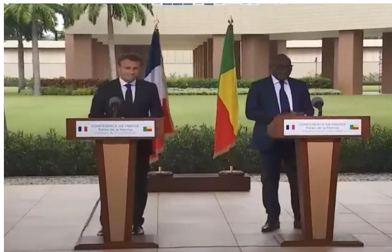
Imagem 1. Posição inicial 2

o movimento de girar a cabeça para olhar o interlocutor que está ao lado. Esse gesto não é o mesmo quando se trata de um pronunciamento a um público que está em frente ao orador, já que, nesse caso, ele levanta a cabeça para perceber o público que está escutando o pronunciamento. No presente contexto, supõe-se que o orador do discurso preste atenção ao público, levantando a cabeça, e também preste atenção, sobretudo, ao colega que está ao lado, girando a cabeça, movimentando todo o dorso para olhar. Para um tal evento gestual, temos como posição inicial a imagem a seguir: