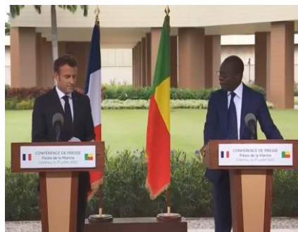
Imagem 4. Exaltar-1

Os dois primeiros excertos relacionam-se com uma estratégia discursiva de exaltar o que se tem feito entre os dois países, em período quinquenal, em diversas áreas da organização política interna e de cooperação entre países com passados ligados que querem andar juntos no presente e no futuro, de acordo com o que Talon deixou transparecer nas suas falas. O último excerto parece funcionar como um convite ou um pedido de cooperação no âmbito militar, para que Benim possa enfrentar com maior êxito a questão do terrorismo que se desenvolve na parte norte do país, vindo de países como Nigéria ou Burkina Faso. Diante de tudo isso, torna-se relevante perceber a razão pela qual parece existir uma necessidade de virar a cabeça para olhar o presidente Macron logo após enunciar essas frases. Vamos considerar as imagens 6 a seguir: