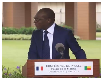
Imagem 5. Exaltar-2