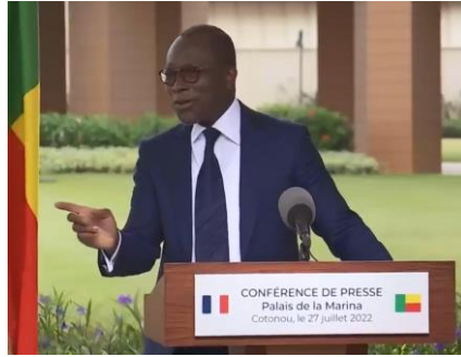
Imagem 6. Âmbito militar

As imagens mostram três atitudes diferentes na ação de girar a cabeça para olhar o presidente Macron, todas ligadas por um gesto comum, o sorriso. Com efeito, percebe-se um sorriso meio aberto na primeira imagem deste bloco, um sorriso muito aberto na segunda e um sorriso irónico na última. Os dois primeiros enunciados, consagrados a enobrecer de que forma e a que ponto se encontram as relações de cooperação entre os dois países, extravasados nos primeiros instantes do discurso e nas primeiras frases do mesmo, tendem a colocar um décor agradável para o seguimento do discurso e, talvez, uma matéria para se orgulhar, bem como, implicitamente, um incentivo a mais ações de cooperação. Isso justifica-se pelo sorriso nítido que se pode testemunhar no rosto do presidente Talon nas imagens 4 e 5. A orientação da cabeça naquele momento constitui um ato ilocutório com o propósito de agradecer e manifestar satisfação de tudo que foi feito até ao momento.