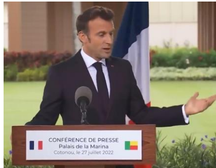
Imagem 7. Agradecimento

longa duração. Vamos considerar as seguintes imagens 7 :