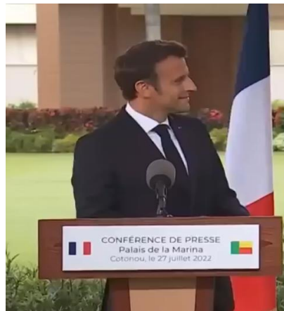
Imagem 3. Macron 4

A partir das presentes imagens, nota-se com mais clareza o movimento feito pelos dois presidentes para direcionar o olhar um para o outro ou prestar atenção ao seu discurso. Esse movimento fez com que eles se isolassem do microfone e deixassem comprometida a audibilidade do som da voz, podendo provocar, talvez, uma quebra de acompanhamento dos argumentos do discurso. Desse modo, ao virar a cabeça, precisavam tomar o cuidado de monitorar o tom da voz para que essa seja suficientemente forte para entrar no microfone e ser audível por todos. Da mesma forma, quando cada um dos presidentes volta à posição inicial, ele deve reajustar o tom da voz para não manter a altura de quando desviou a cabeça, correndo o risco de a voz sair muito forte ao microfone. Assim, o microfone condiciona a postura ao