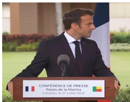
Imagem 8. Convite

As duas imagens aqui apresentadas mostram a realização no tempo, desde o seu início até à sua total realização, do gesto de orientação de cabeça. Como se pode compreender, a ideia da afirmação é que a exposição artística vista por Macron em Cotonou seja realizada em Paris, a partir de uma negociação entre os governos. Desse modo, o primeiro gesto foi realizado quando Macron pronunciou “ si cela est possible ”, que marca o início do movimento. A imagem mostra que, além do movimento de cabeça, toda a mão está orientada na direção de Talon. A enunciação e a mão estendida apenas têm uma informação, cuja interpretação poderá ser semelhante a “gostaríamos que isso acontecesse, no entanto, entenderemos se isso não for possível”. Isso é uma forma de respeito e de consideração do presidente Macron, entendendo