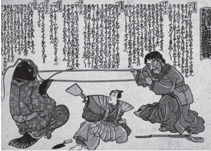
Figura 2 (Neck-pulling game between the earthquake catfish and Commodore Matthew Perry)

Amidst this pervasive sense of the traumatic sublime 11 , from the unconsciousness of Edo folk arose Yōkai spirits (妖怪, ghost, phantom, strange apparition) to explain the cosmological, mystical and allegedly supernatural significance of the natural disaster. 12 This came only a few decades after Japan suffered a series of natural disasters, epidemics and famines in the 1830s which led to popular protest. The common belief was that there was an imbalance in the cosmic forces of the earth. In their superstitious way, Yōkai spirits helped to articulate this fear. 13 In the wake of the earthquake, artists expressed visions of Japan during the «month without gods» ( Kannazuki , 神無月) and hundreds of woodblock prints featuring the giant catfish