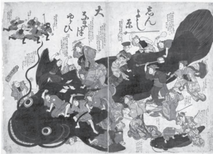
Figura 4 ( The cause of the great catfish at Shin Yoshiwara )

Others show a preference for the almighty saving power of Amaterasu (the great Divinity Illuminating Heaven) rather than Kashima. In this respect, as Namazu-e show a conflict between Kashima and the spiritual founder of Japan this fact points to the collective unconscious of the Japanese. In the subterranean terrain of the collective unconscious we find a conflict between the imperial house and the shogunate , a conflict foreshadowing the eventual overthrow of the Tokugawa shogunate regime and the imperial restoration of 1867 – ending the Edo period of Japanese history.