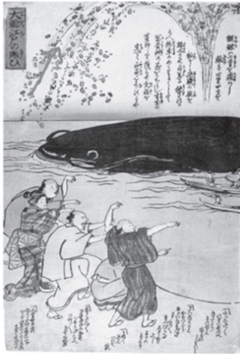
Figura 1 (Story of the big catfish of Edo)

The Namazu-e are prints which depict monsters living in a sublime interstitial world, in between the collective imagination and the traumatic memory of natural catastrophe 4 . They have been described as «a handy, cheap, disposable tool for helping to create Japan as a nation...» 5 They constituted a «high degree of linguistic and visual sophistication» 6 and «a powerful form of political rhetoric for a group theoretically forbidden from engaging in political discourse» 7 . In other words, the natural disaster raised social and political questions in and through the natural catastrophe. In the «crisis event» of the earthquake 8 we find the aesthetic expression of resistance to the political status quo. Here the aesthetics of existence is dissensual. It says no. We can say the 1855 Edo earthquake traumatised the