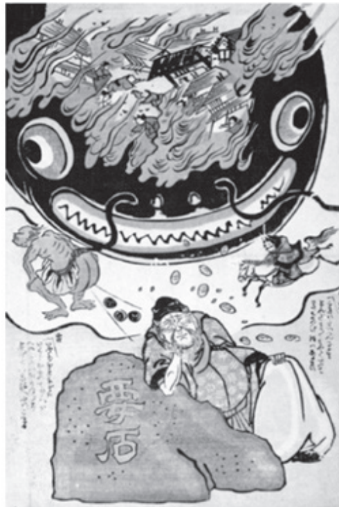
Figura 3 (The deity Ebisu falls asleep while guarding the foundation stone [Kanameishi] for Kashima)

Kashima was perceived as a powerful divinity close to the terrestrial world, in communion with humans, and a safeguard of order and stability. In mythology, when Kashima was absent, the Namazu stirred and caused violent earthquakes. Some woodblock prints highlighted the destruction and deaths wrought by the catfish; others affirmed the catfish as a harbinger of Yonaoshi or world change because in the Shinto religion, kami – gods or spirits – are bound to a particular place and reflect the regenerating forces of nature. In the animist tradition, Namazu are worshiped as Yonaoshi Daimyōjin or gods of world rectification.