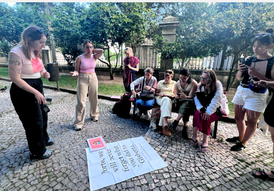
Momento do Tour Feminista do Porto guiada pelo coletivo MAAD, com o grupo reunido para uma das paradas de discussão ao longo do percurso sobre Gisberta e suas memórias

A caminhada percorreu pontos como o Largo Amor de Perdição, a Rua de Cedofeita, o Jardim de São Lázaro, a Biblioteca Municipal do Porto, o Cemitério do Prado do Repouso e fez referência ao Edifício Pão de Açúcar. Em cada parada, histórias eram desveladas: Ana Plácido, escritora silenciada e subordinada à memória de Camilo Castelo Branco; Carolina Michaelis, intelectual homenageada, mas ainda exceção à regra de apagamento; Gisberta Salce, mulher trans brutalmente assassinada, cuja lembrança ainda é objeto de disputa, entre outras.