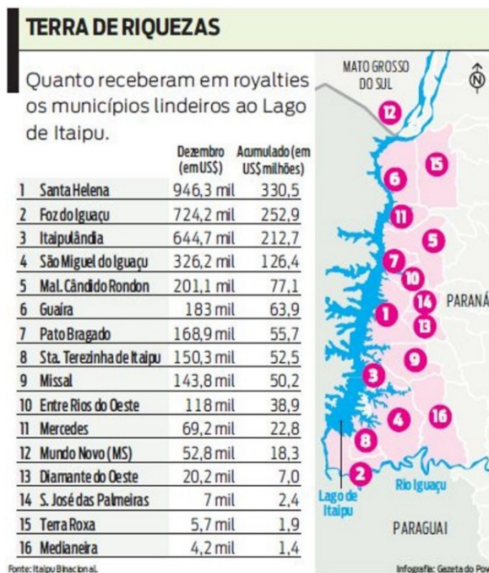
Figura 2 Royalties pagos aos municípios Lindeiros em 2011

O CDMLLI (2021) menciona que 16 municípios (15 do Paraná e 1 do Mato Grosso do Sul) fazem parte dos municípios Lindeiros originados pelo impacto ambiental gerado pela Itaipu Binacional na década de 1980. Trata-se de uma microrregião que tem passado por transformações territoriais e socioeconômicas (Xavier, 2014), recebendo royalties devido à submersão do ponto turístico conhecido como Salto das Sete Quedas de Iguaçu que resultou, inclusive, em outra configuração territorial-política àquela região. A compensação financeira (royalties) que os municípios recebem da Itaipu Binacional representa uma parte significativa das receitas, mensal e anual, desses municípios (Xavier, 2014).