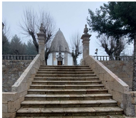
Foto 5 - Escadório de acesso e capela de Nossa Senhora da Piedade.

A chegada ao recinto é marcada por uma fonte, sendo a presença da água constante e vital à existência de um santuário e de “importância transcendental para as comunidades rurais, agrícolas” (Duarte, 2019: 59), assumindo como regeneradora e purificadora, do corpo e espírito do romeiro. Este elemento está fortemente associado ao cristianismo, como a soma universal das virtudes (Eliade, 1957: 108), as águas existiam antes de Terra “Que exista um firmamento no meio das águas para separar águas de águas” (Gênesis 1:6) e apresenta-se como elemento-chave do batismo, ritual de iniciação do Homem ao cristianismo. De igual modo, a presença da água à chegada permite ao peregrino refrescar-se, ajudando também a enfrentar as maleitas de que padece. Tem, assim, uma forte presença na experiência sensorial do devoto, marcada, antes de mais, pelo som, seguida do tato e do palato, aos quais confere frescura. Assim se inicia a derradeira parte de ascensão, o escadório, que aqui se assume como monumentalização de todo o percurso. Este termina em frente da capela principal (foto 5), “simbolicamente o fim da caminhada e local maior para a meditação dos peregrinos” (Massara, 1988: 24).