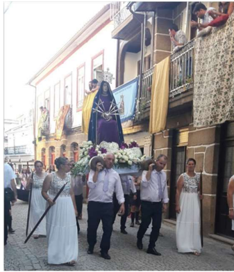
Foto 7 - Procissão de Gala (2021). Andores com flores; Colchas .

No tempo mais alargado das festividades, o centro urbano da vila vê alterada a configuração dos seus espaços públicos e das vivências que nele se desenvolvem, entre os quais são de maior impacto os arcos que alteram visualmente as ruas, conferindo cor e brilho, mas também uma nova noção de espacialidade a quem os atravessa. A par destes, as estruturas que se montam para receber o palco, ou os lugares de venda, alteram também a organização do espaço.