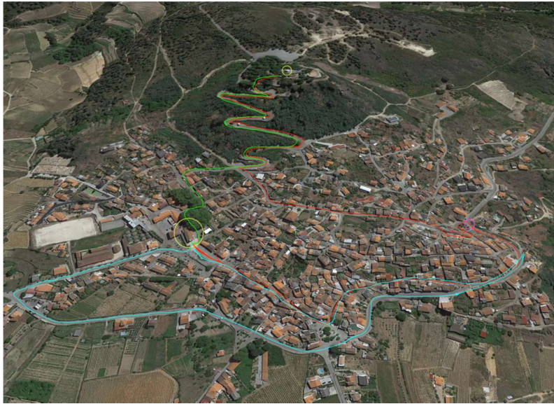
Foto 6 - Percurso das procissões . Amarelo: Capela de Nossa Senhora da Piedade e Igreja Paroquial. A vermelho: Procissão do Encontro; a rosa: Local do Encontro; a azul: Percurso da procissão que vai ao encontro e Procissão de Gala; a verde: Procissão de regresso ao santuário.

A Procissão de Gala deve começar com o tanger dos sinos, aos quais se junta a banda filarmónica que abre o cortejo, seguida de outras bandas, fanfarras e grupos de bombos. No seu conjunto, estes anunciam a todos os que aguardam que esta se aproxime. Simultaneamente, as cores das colchas nas varandas e janelas conferem às ruas uma nova e efémera roupagem (foto 7). Este apelo aos sentidos transporta-se também aos vários andores, de diversas santidades – encerrado pelo de Nossa Senhora da Piedade – que, pela avultada quantidade de flores que os ornamentam (foto 7), espalham um diferenciado odor floral. Este tipo de ornamentação é de utilização recente. Há registos fotográficos nos quais os andores, de alçado mais elevado e esguio, eram revestidos com um trabalhado de recortes em papel.