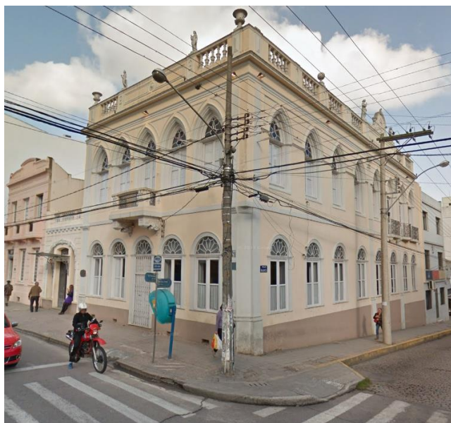
Figura 1 - Antiga sede da Escola de Belas Artes de Pelotas, a partir de 1963, situado na esquina da R. Marechal Floriano com a R. Santa Tecla. Google Maps. 2023.

Fonte: Captura de tela do Google Maps. Disponível em: