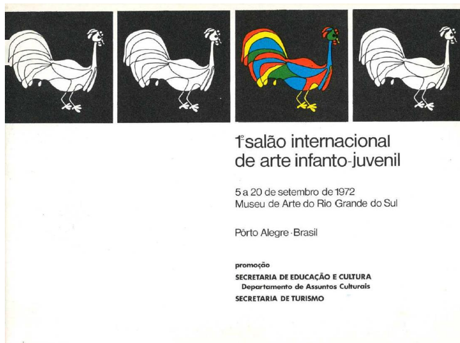
Figura 3 - Capa do catálogo do 1o. Salão Internacional de Arte Infanto-Juvenil. 1972.