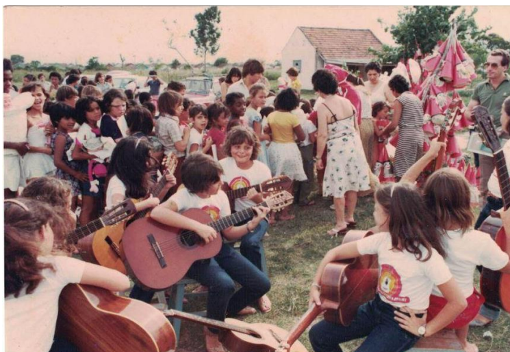
Figura 4 - Dia da Criatividade no bairro Navegantes, na cidade de Pelotas. Aproximadamente. Fotografia, Autor desconhecido, 1980.

ao ar livre, tanto em áreas urbanas centrais quanto em bairros periféricos da cidade de Pelotas, para escolares e a população experimentarem as mais diversas linguagens artísticas (Sirtoli, 2022).