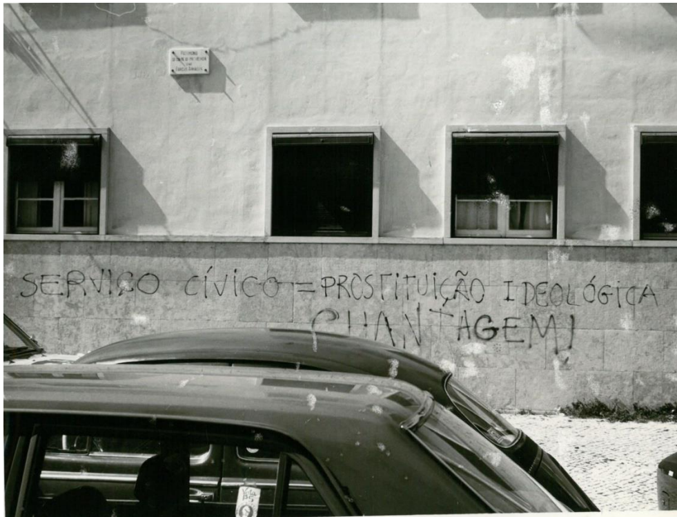
Figura 2. FT 12206, CD25A

Disponível em https://www.cd25a.uc.pt/en/page/2662/2