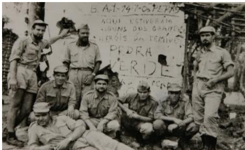
Figura 1. Militares artilheiros, os Peras, do 3º Pelotão da Bateria de Artilharia 147, em Quisacala, junto da Pedra Verde