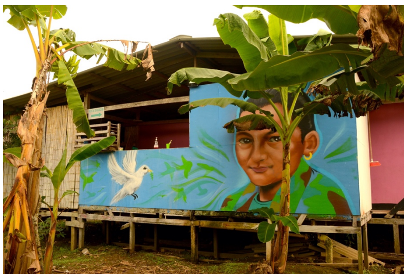
'Paloma'. Artiste : Balam.

Grâce au monde symbolique recréé par les artistes, ces derniers ont pu aider à donner du sens aux pertes humaines, affectives, et à leur faire une place dans le présent à travers des hommages. 'Pedro', par exemple, a exprimé aux artistes son besoin de peindre près de chez lui, une ancienne compagne, morte au combat. Elle s'appelait 'Paloma' et une colombe blanche – paloma en espagnol –, qui symbolise la paix et la liberté, accompagne son portrait.