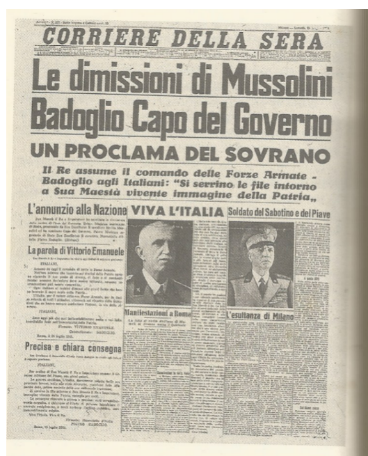
Page 340, Quotidien italien publié à Milan depuis les années 40, Corriere della Sera , paru le 26 juillet 1943

Plus loin, le journal apparaît en support physique. Cette représentation matérielle permet au lecteur de lire le journal au même titre que le narrateur Yambo.