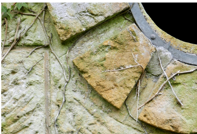
Illustration 4 : cartes postales éditées dans le cadre du projet Paysage(s) de l'étrange , photographies extraites de l'exposition Surfaces mouvementées .

D'autres artistes se sont naturellement intéressé.e.s au patrimoine du Grand Est et aux traces des conflits qui s'y sont déroulés et dont Verdun représente indéniablement l'exemple le plus célèbre. On remarque d'ailleurs une prédilection pour le médium photographique qui, tout comme le travail basé sur des documents d'archives (le research based art mentionné auparavant), permet l'ancrage dans un territoire réel. Concrètement, il s'agit pour ces « photographes-historiens » de rendre visibles et intelligibles les traces du passé dans les paysages d'aujourd'hui. Il ne s'agit point, dans ces travaux, de représenter ce qui a trait à la mémoire, mais de présenter une mémoire latente, qui habite notre environnement actuel.