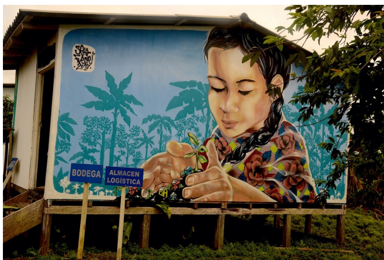
Construyendo Pueblo . Artiste : Seta Fuerte.

Ces récits, d'un caractère presque confessionnel, autobiographique, intime, secret, sont les référents de la « mémoire vive », racontée par les propres protagonistes des événements mis en lumière. Ceux qui ont eu un rapport direct ou indirect avec le conflit en question et qui se trouvent en vie sont des sources vivantes. La « mémoire vive » ne se nourrit pas seulement du passé, « (...) cuando se hace el ejercicio de recordar, se reviven sentimientos y emociones, lo que hace de esto una experiencia siempre diferente, pues se alimenta constantemente del presente. Memoria viva en cuanto mirar hacia el futuro y se construye dentro de un marco de esperanza, de no repetición de los hechos de violencia » (Giraldo, Toro, 2018: 104) 52 .