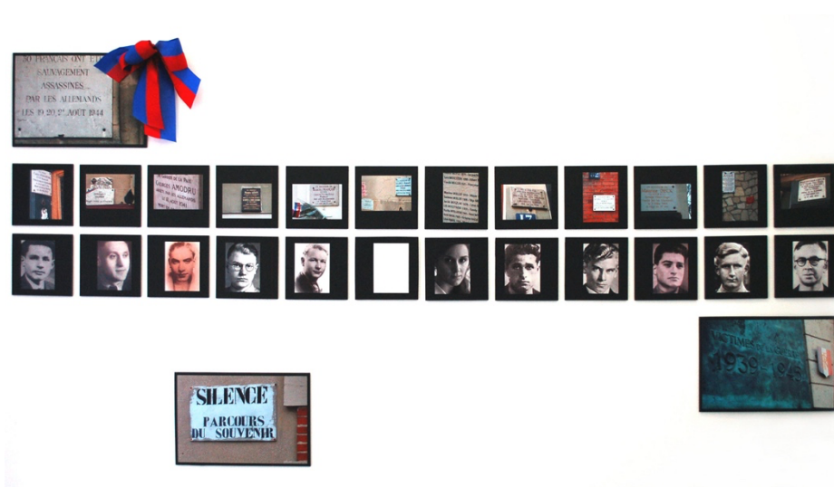
Illustration 2 : Fragments de mémoire, vue de l'installation.