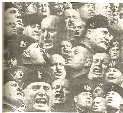
Page 439, photomontage pour le dixième anniversaire de la révolution fasciste, Rome, Institut Luce, 1932.