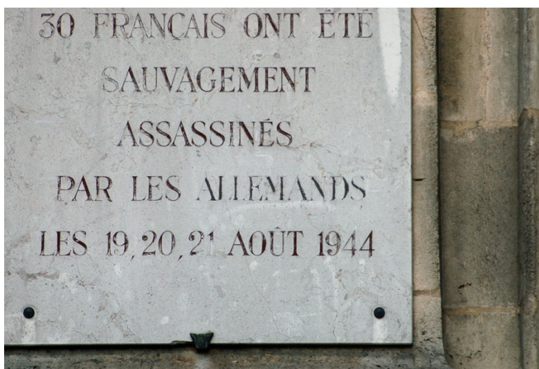
Illustration 1 : plaque commémorative, Paris.