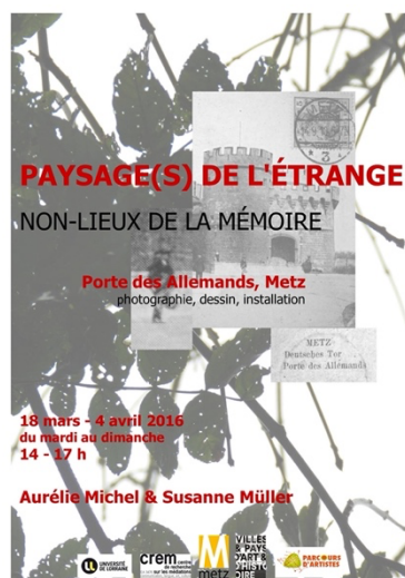
Illustration 3 : affiche de l'exposition Non-lieux de la mémoire, Metz, 2016.

Programmée dans le cadre d'un festival célébrant l'amitié franco-allemande, Metz est wunderbar (l'adjectif allemand wunderbar signifiant « merveilleux »), une deuxième exposition – Traces, vestiges, reliques : le patrimoine culturel d'une ville au prisme de son passé franco-allemand – a eu lieu en 2017 à la Basilique Saint-Vincent, église désaffectée de la ville de Metz servant désormais de salle d'exposition. Conçue par et pour un public jeune, elle a permis à des étudiant.e.s de licence Arts plastiques d'y exposer leurs travaux réalisés lors d'un cours de pratique consacré à l'histoire franco-allemande de la ville, cours qui a été pour certain.e.s l'occasion de découvrir ce passé complexe et ambigu.