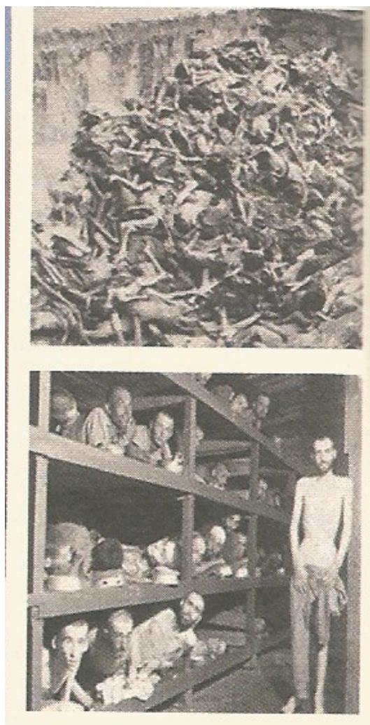
Page 416, photographies de camps de concentration allemands, apparue dans le quotidien Corriere Lombardo du 8 août 1945

La présence de cette première page de journal (plus haut à gauche) expose des titres très révélateurs et salvateurs pour les italiens de l'époque : « La démission de Mussolini chef du gouvernement, L'annonce à la nation, Manifestation à Rome, L'exultation de Milan : vive l'Italie ».