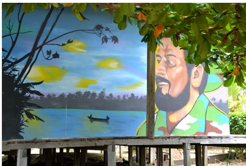
'Bernardo'. Artiste : Balam.

Le projet peut s'inscrire dans une pratique qui englobe l'art engagé de caractère activiste, un art in situ , qui est en relation directe avec le lieu d'accueil. Un art qui veut être entendu, qui défend ses propos et qui ouvre le débat face à l'opinion dominante. L'art contribuerait ainsi à l'amélioration de la société à travers ses mécanismes, l'artiste étant lui-même citoyen, concerné par la vie publique et impliqué dans la transformation d'un contrat social en quête d'être (re)négocié.