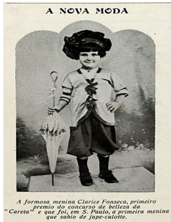
Fig. 2 – Revista Careta - Calça jupe-culotte