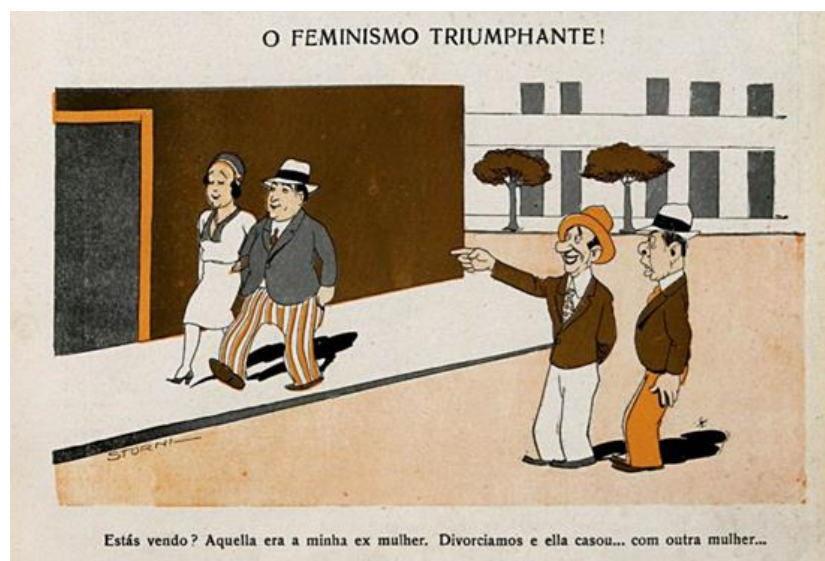
Fig. 9 – Revista Careta , 31 jan. 1934