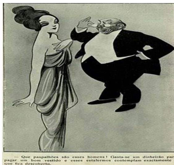
Fig. 7 – Revista Careta , 20 set. 1913

Fonte: BRASIL. Biblioteca Nacional - Hemeroteca digital (2020)