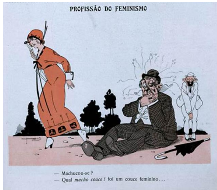
Fig. 8 – Revista Careta , 31 jan. 1914