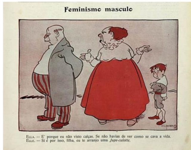
Fig. 4 – Revista Careta , 8 abr. 1911