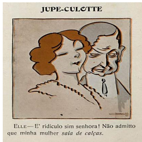
Fig. 3 – Revista Careta 25 mar. 1911, p. 23