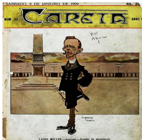
Fig. 1 – Capa da Revista Careta de 1909