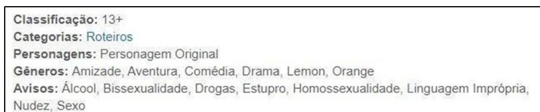
Fig. 2 – Exemplo de uso incorreto de descritores

Como é explicado na Fig. 1, o repositório possui apenas 31 gêneros — bem menos em relação ao repositório Spirit (52) —, ainda assim, ele apresenta diversos problemas com o uso dos descritores, pois postagens como essa são frequentes nos grupos. Abaixo (Fig. 2) é apresentado um exemplo do uso equivocado dos termos de indexação.