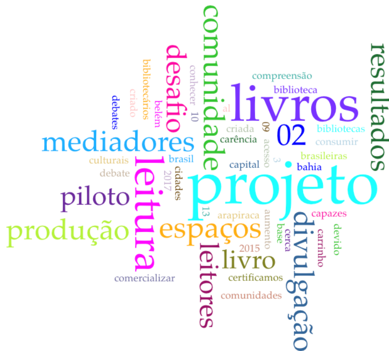
Fig. 6 – Palavras relacionadas à seção “Justificativa” dos projetos vinculados à sustentabilidade econômica.