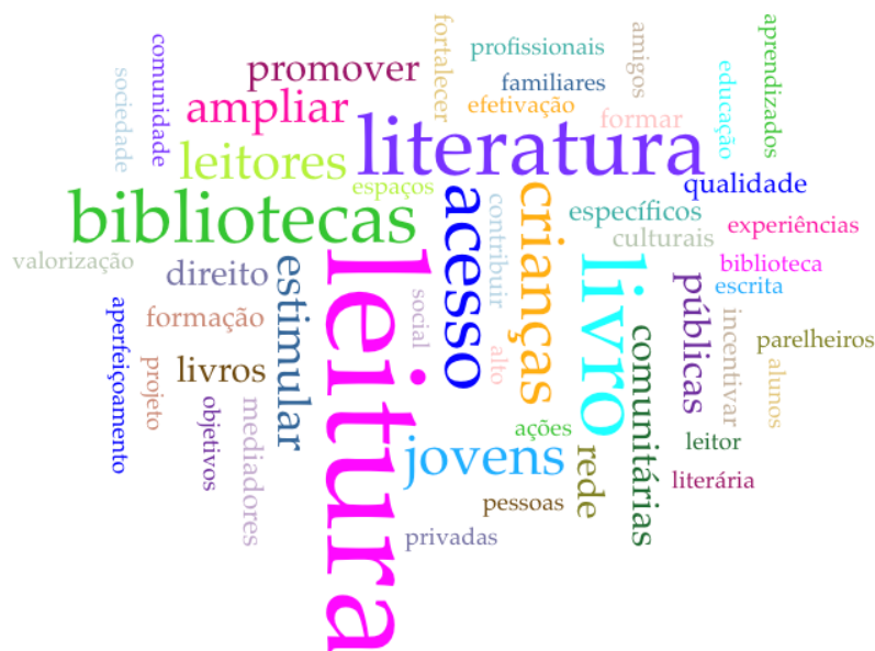
Fig. 7 – Palavras relacionadas à seção “Objetivos” dos projetos vinculados à sustentabilidade política.

Os projetos de leitura premiados em 2017 são estes: “Projeto de leitura 02”, “Projeto de leitura 03”, “Projeto de leitura 07”, “Projeto de leitura 08”, “Projeto de leitura 17”, “Projeto de leitura 19”, “Projeto de leitura 21”, “Projeto de leitura 24” e “Projeto de leitura 33”. Os com prêmio concedido em 2018 são os seguintes: “Projeto de leitura 04”, “Projeto de leitura 11”, “Projeto de leitura 16”, “Projeto de leitura 18”, “Projeto de leitura 20”, “Projeto de leitura 25” e “Projeto de leitura 34”. Por outro lado, os projetos premiados em 2019 são o “Projeto de leitura 01”, “Projeto de leitura 06”, “Projeto de leitura 12”, “Projeto de leitura 22” e “Projeto de leitura 25”. A seguir, a Fig. 7 demonstra a nuvem de palavras que evidencia o conteúdo da seção “Objetivos” desses projetos.