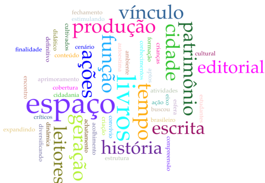
Fig. 2 – Palavras relacionadas à seção “Justificativa” dos projetos vinculados à sustentabilidade cultural.

Por outro lado, a Fig. 2, vista logo em seguida, apresenta outra nuvem de palavras, esta utilizada para representar o conteúdo da seção “Justificativas” dos mesmos projetos.