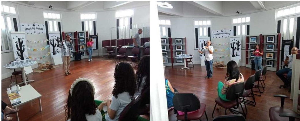
Fig. 3 – Registros da atividade ‘Terça do Cordel’