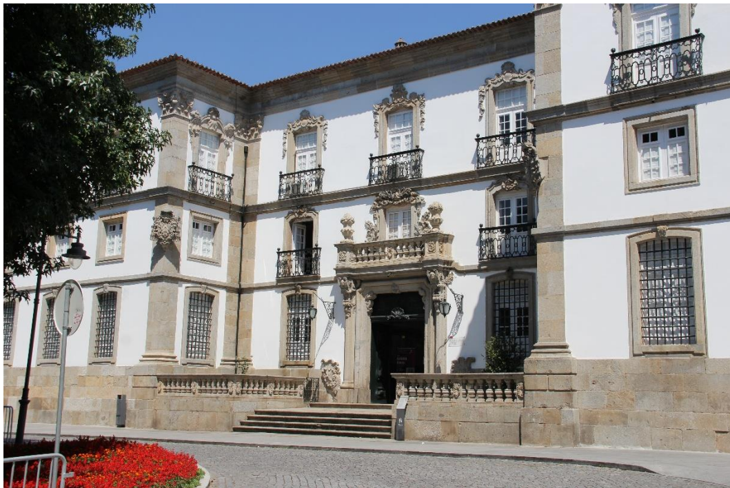
Biblioteca Pública de Braga, fachada