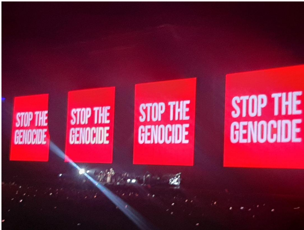
Fig. 2 - Telão exibindo a mensagem Stop the Genocide durante show do músico britânico Roger Waters em São Paulo - novembro de 2023