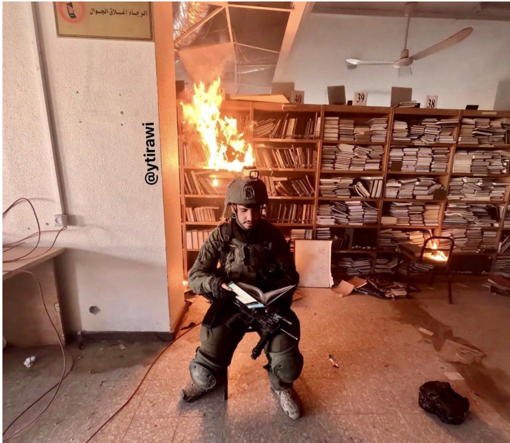
Fig. 1 - Soldados israelenses ateam fogo na biblioteca da Universidade de Al-Aqsa, Gaza, e se fotografam entre as chamas