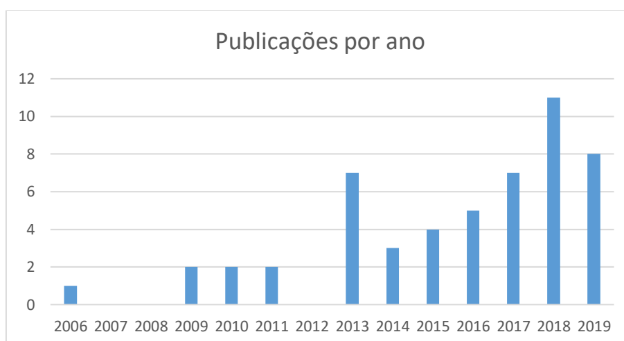
Figura 2 - Publicações por ano

Considerando os valores da Tabela 3, podemos verificar que 31 (59,6%) dos 52 trabalhos identificados, foram realizados nos quatro últimos anos reportados, mostrando um aumento do interesse pelo uso e exploração do método quadripolar, conforme a Figura 2 ilustra.