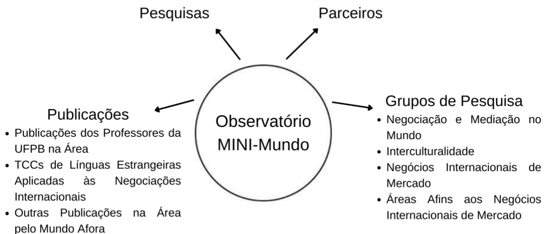
Figura 2 - Estrutura do Observatório MINI-Mundo