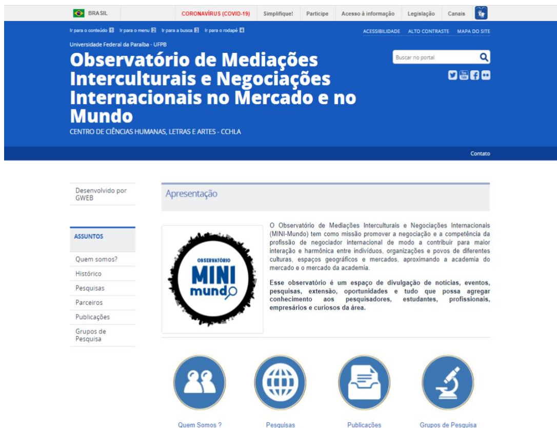
Figura 1: Homepage do Observatório

Já a homepage do Observatório foi organizada de forma que o acesso aos conteúdos seja de forma direta e as cores e modelo do site lembram a página da instituição (UFPB), à qual a base inicial do Observatório pertence. O site, no momento, possui o seguinte visual inicial ao ser acessado: