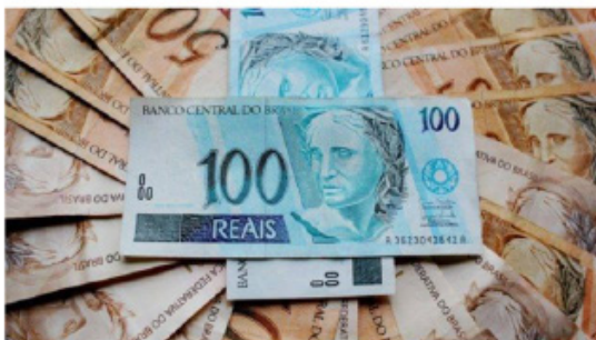
Figura 3 - Concentração de rendas