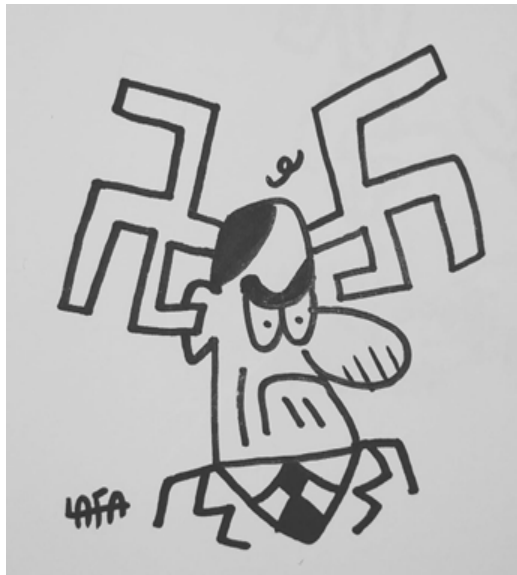
Figura 4 - Bolsonaro vinculado ao nazismo

Houve outro caso em que a figura de Jair Bolsonaro foi usada para vinculação ao discurso nazista. O trabalho é de Daniel Lafayette e foi veiculado em 02 de março de 2020, nos perfis do Facebook e do Instagram do desenhista: