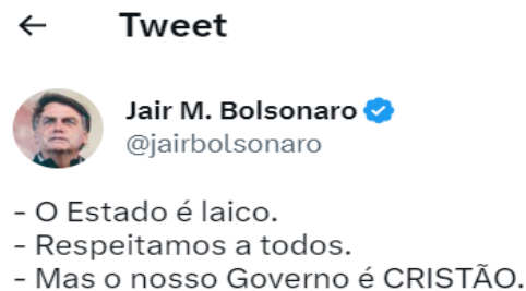
Figura 1 - Publicação do ex-presidente