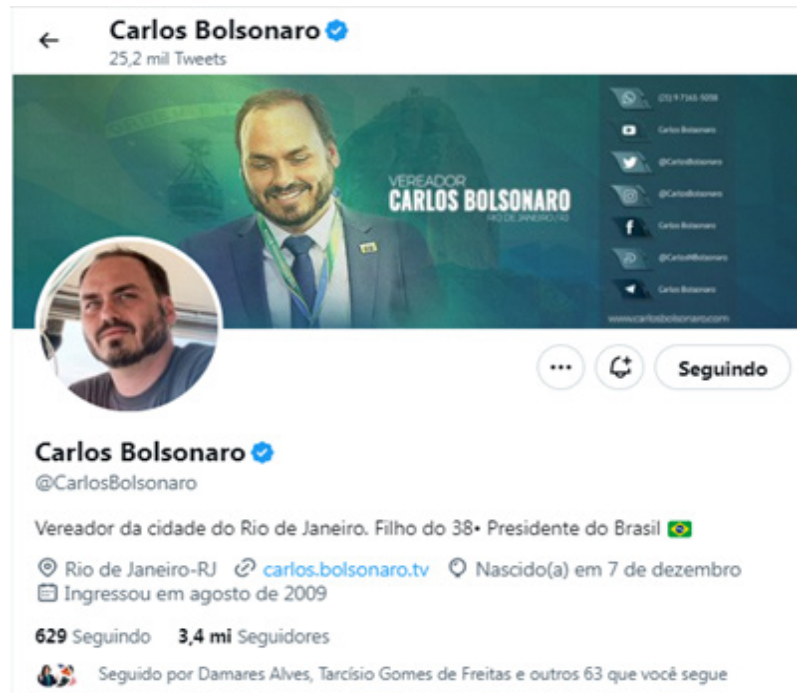
Figura 2 - Captura de tela do perfil de Carlos Bolsonaro no Twitter

Pela campanha de Jair Bolsonaro, o personagem em evidência foi o vereador pelo Rio de Janeiro Carlos Nantes Bolsonaro (@CarlosBolsonaro), do Republicanos, que desde a eleição de 2018 já coordenava a campanha do pai nas redes sociais (figura 2).