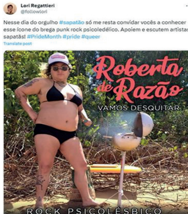
Figura 3 - “Rock Psicolésbico”

Movimentos similares compõem o texto analisado a seguir.